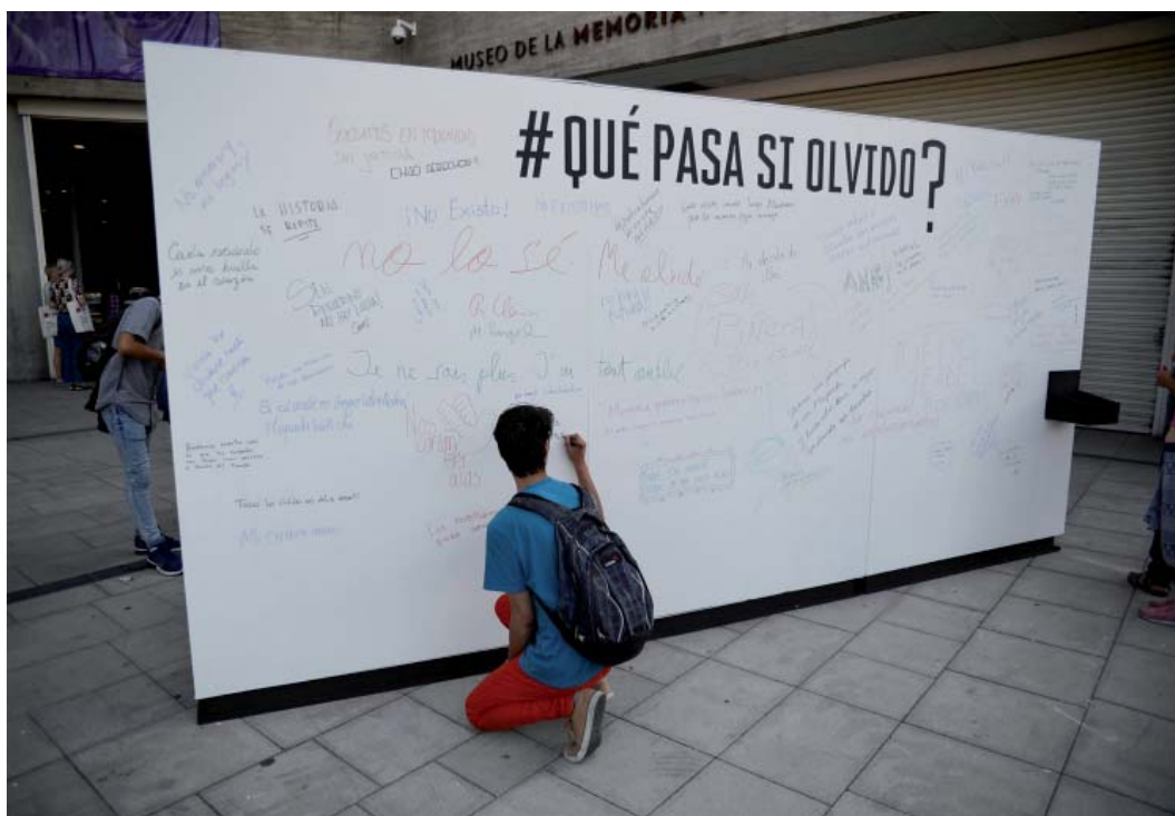
Anexo 4. Mural interactivo en el Museo de La Memoria y los Derechos Humanos en Santiago, Chile