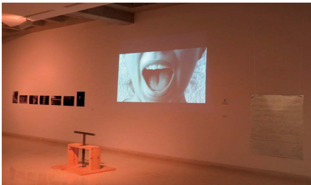
Anexo 1. Exposición Obra abierta/ejes de libertad en el Museo de Arte Contemporáneo del Zulia, marzo de 2016)

distintas regiones y organismos mundiales, y debido a su carácter dinámico Carter y Orange (2011) añaden que la reflexión sobre el activismo en DDHH es inagotable. El museo requiere investigaciones actualizadas para abordar un conjunto de leyes y conceptos que sufren una modificación continua.