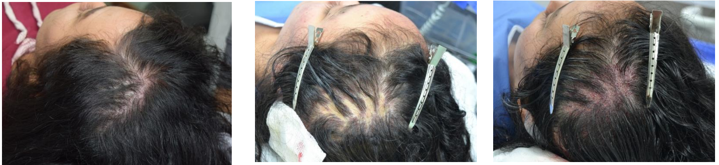
Figura 3. Fotografías de seguimiento: A: antes del microinjerto, B inmediatamente después del microinjerto y C: un año después.