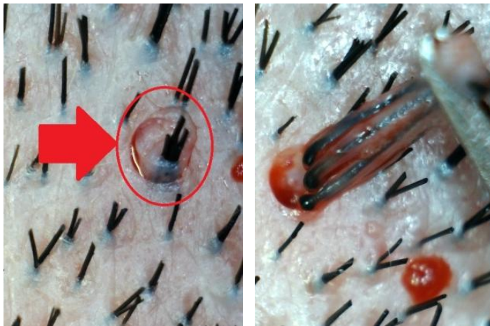
Figura 1: Tricoscopia con aumento 35X, A: muestra incisión circunferencial de la UF, B: tracción con pinza curva para liberar la UF