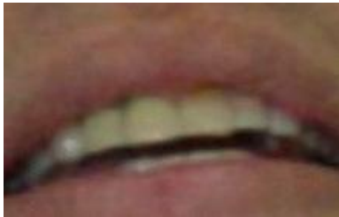
Figura 7. Prótesis inmediata fija instalada