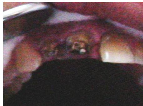
Fig. 2. Evolución Clínica de la intervención a los 7 días

planificado (1:1 y 2:1) mediante el procedimiento convencional de este método. Los pivotes o pernos para los endoimplantes, fueron confeccionados en el laboratorio de prótesis con cromo-cobalto-molibdeno (Fig. 1), como refleja la literatura (4-