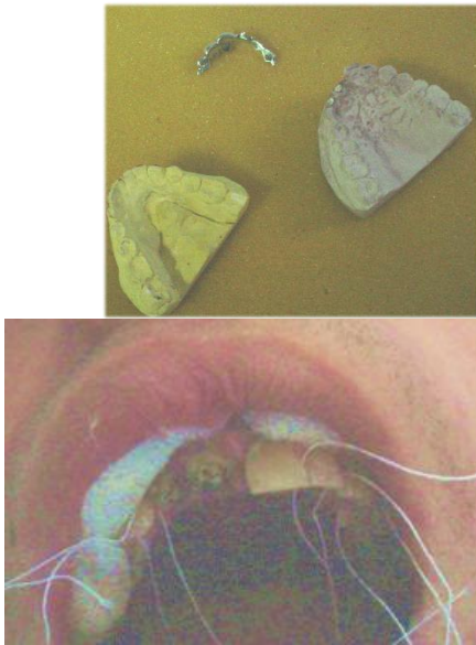
Figura 5. Modelo de yeso por los métodos convencionales. Figura 6. Hilo dental colocados en los espacios interdentarios

Se logró rehabilitar al paciente afectado estética y psicológicamente devolviéndolo a su vida social rehabilitado con una prótesis inmediata fija (Fig. 7) y en la Fig. 8 se observa el tratamiento culminado con la recromia de 2:1. Pasando un tiempo prudencial y