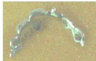
Figura 4. Estructura metálica con

La parte técnica se realizó sobre un modelo de yeso (Fig. 5) por los métodos convencionales y obtener un puente resistente apoyado sobre las caras linguales vecinas, que se corroboró en la prueba de la estructura metálica. Al obtener un puente estéticamente aceptado por el paciente y el profesional se procedió a la fijación del mismo con resinas autocuradas, sin realizar cavidades