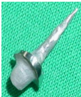
Fig. 1 Endoimplantes cromo-cobalto-molibdeno

La técnica aplicada consistió en actividad quirúrgico-endodóntica en una sesión, con la instalación de un implante endodóntico en cada diente 8).