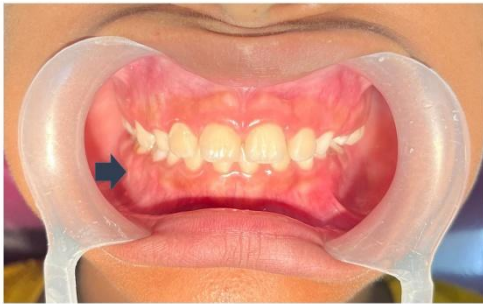
Figura 2 a : Imagen Clínica Frontal.