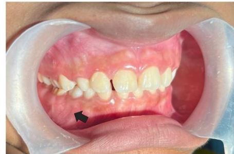
Figura 2 b : Imagen Clínica Lateral.