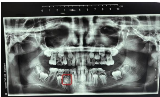
Figura 1 a : Radiografía Panorámica.

Se realiza interconsulta con especialidad en cirugía y estomatología oral corroborando el diagnóstico descrito y sugiriendo como tratamiento pertinente la remoción de la misma, bajo anestesia general para dar inicio a un plan de trabajo que permita la erupción correcta de los órganos dentales permanentes y evitar futuras complicaciones que afecten funcionalidad y estética de la paciente.