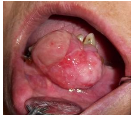
Figura 1. Manifestación clínica de la lesión.

examen físico se evidencia una lesión exofítica ubicada en la encía adherida del sector anteroinferior, con las siguientes dimensiones 35x30x15mm, asociada a órganos dentarias 33, 32, 31, 41 y 42 con caries y enfermedad periodontal, de color rosa pálido con zonas eritematosas y amarillas parduzcas, base pediculada, móvil, textura rugosa, sin ulceraciones, crecimiento indoloro con año aproximado de evolución (Ver figura 1).