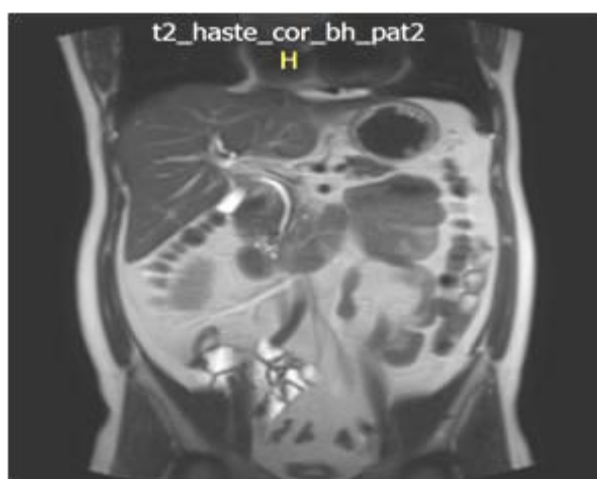
Figura 4. Colangiorenancia 14 semanas postoperatorio