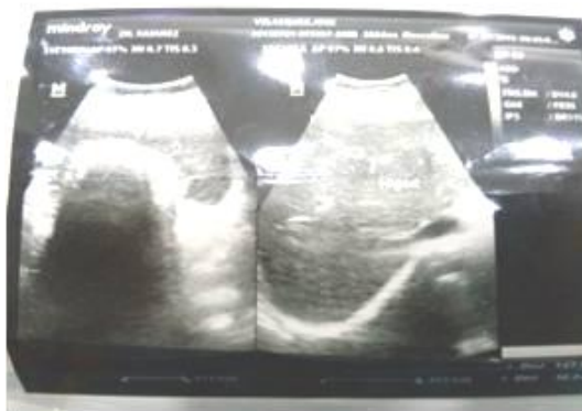
Figura 1. Ecosonograma abdominal, única imagen ecográfica realizada en el preoperatorio

Es llevado en julio 2015 a quirófano, iniciándose colecistectomía laparoscópica convencional de 4 portales; al insuflar la cavidad y visualizar lecho hepático, se evidencia plastrón conformado por epiplón, hígado y segunda porción de duodeno en lecho biliar, no disecable de forma segura por laparoscopia, por lo que se decide convertir procedimiento a laparotomía biliar. Se procede a adherensiólisis del plastrón con evidencia de trayecto fistuloso comunicando confluencia de conductos hepáticos con segunda porción de duodeno.