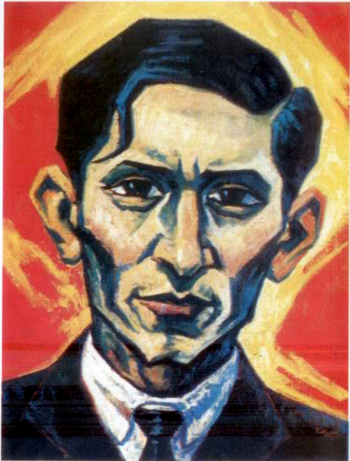
José Carlos Mariátegui