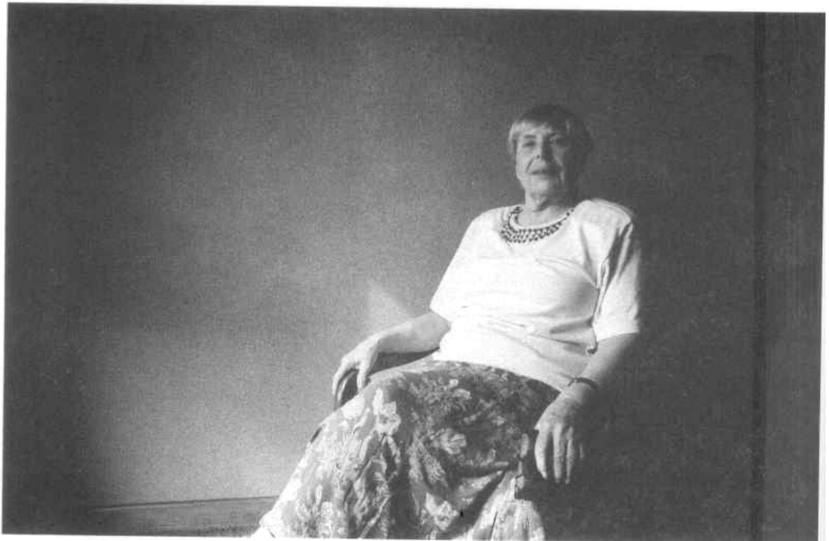
Jean Franco, Caracas, 1996