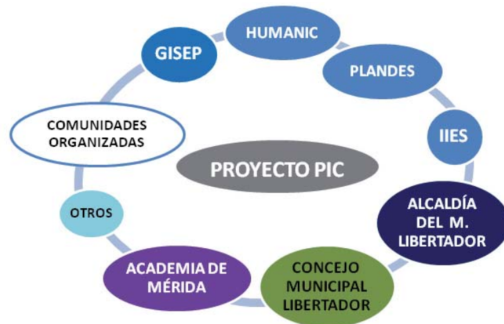
Gráfico N° 2: Conformación institucional actual del equipo de trabajo.