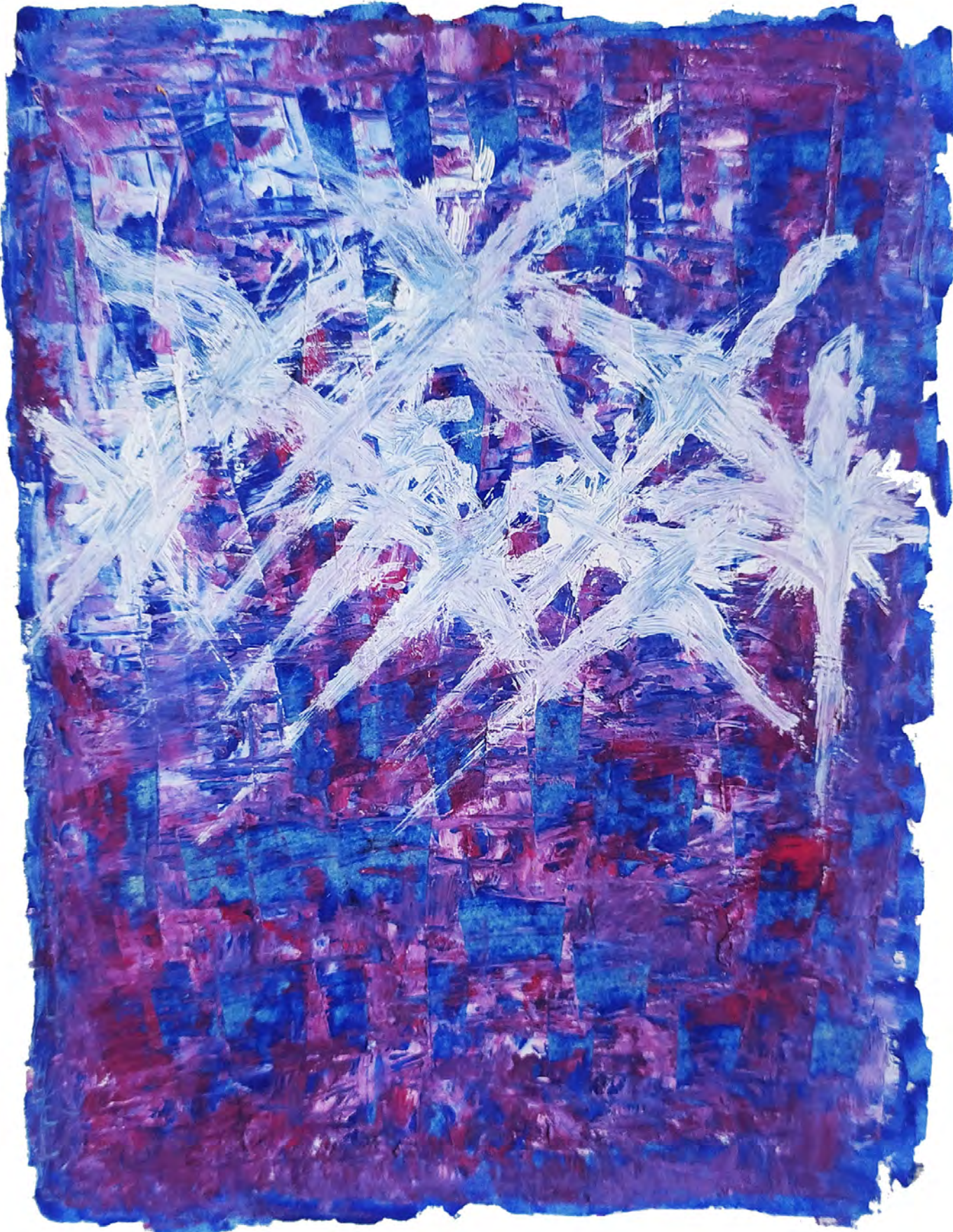
Pajarracos blancos sobrevolando la ciudad Anibal León - Año 2021