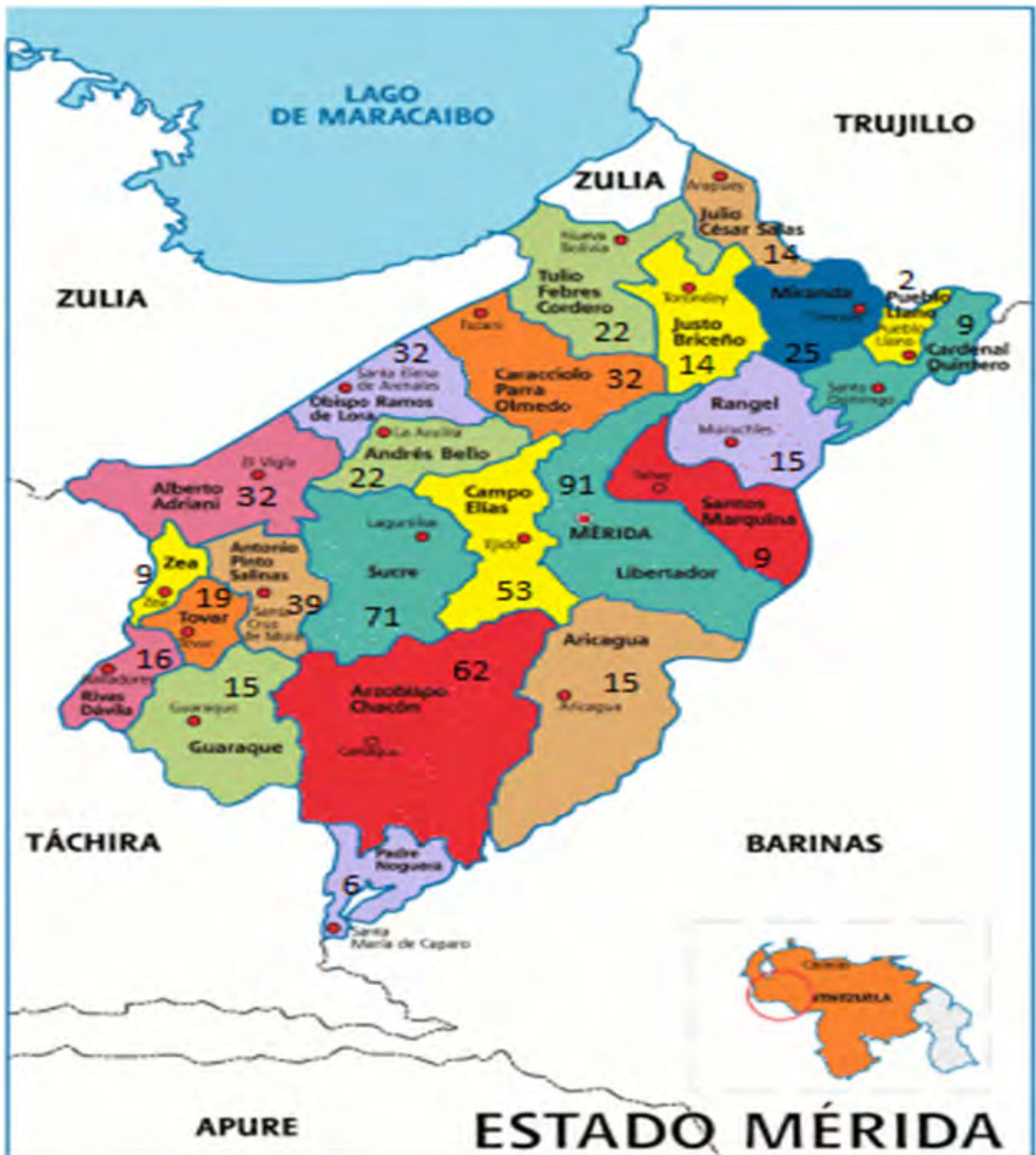
Anexo 3 Distribución por Municipios de las Instituciones Educativas dependientes de la Gobernación del estado Mérida. Angulo (2020)

A continuación se muestra gráficamente el número general de estas instituciones educativas distribuidas en cada uno de los municipios del estado Mérida.