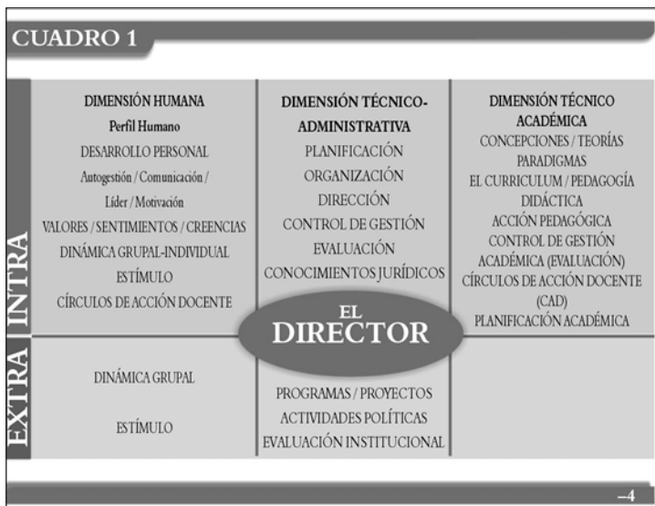
Cuadro 5. Quintero, E. (2005).

Luego, se presenta la Faz Interna (FI) y la Faz Externa del Director y las dimensiones en las cuales se dividieron sus roles. En la FI se describen las dimensiones Humana, Técnico- Administrativa y Técnico Académica del director y en la FE se describen las dinámicas grupales, los programas y proyectos, actividades políticas y la evaluación institucional