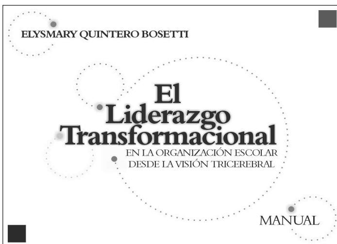
Figura 3. Quintero, E. (2005).