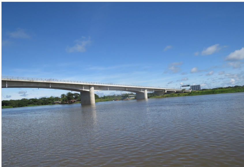
Figura 1. Puente Santa Fe sobre el Río San Juan, Nicaragua

los gobiernos locales e integrará a los líderes comunales.