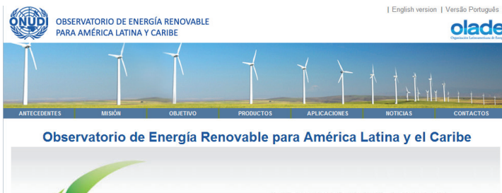
Fig. 2 Plataforma del Observatorio de Energía Renovable

Constituye quizás la actividad más desarrollada y comprende los siguientes aspectos: