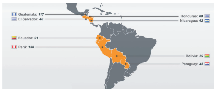
Fig. 1 Distribución regional del programa EURO SOLAR