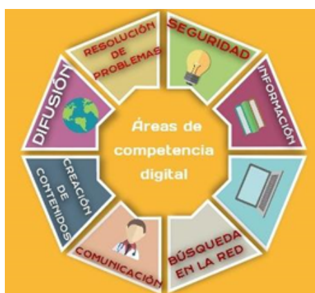
Figura 2. Áreas de la competencia digital

El book-trailer es un buen ejemplo de producción y difusión de textos literarios y permite así mismo el desarrollo de las áreas de la competencia digital: