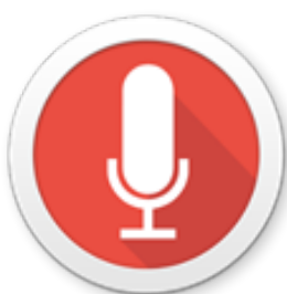
Figura 9. Audio recorder en la grabación de los archivos de audio