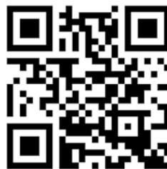
Figura 3. Código QR con pasajes del libro

- Selección por parte de los alumnos de pasajes significativos, que se encriptan en códigos QR. Con una sesión de clase ha sido suficiente. He aquí un ejemplo: