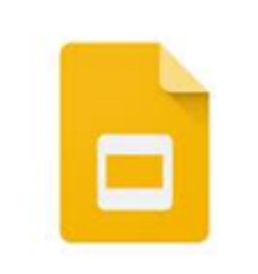
Figura 10. Google drive para la presentación