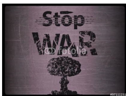
Figura 5. Imagen libre de derechos de autor

- Búsqueda de fotografías y archivos de audio libres de derechos de autor. Esta tarea se ha realizado en clase y en casa por parte de los alumnos. Un ejemplo: