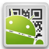
Figura 7. QR Droid para crear códigos QR

Herramientas utilizadas en la elaboración del book-trailer