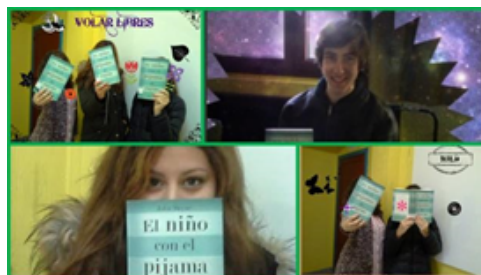
Figura 4. Imagen editada por los alumnos

- Realización y edición de fotografías en una sesión por parte de los alumnos: