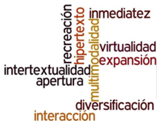
Figura 1. Nuevos modos de lectura

La introducción de las TIC en la educación ha llevado a nuevas prácticas de alfabetización, que van más allá de la lectura y escritura e incluyen otros lenguajes y tecnologías: “los estudiantes se enfrentan cotidianamente a la comprensión y creación de textos multimodales y al uso cada vez más generalizado del entorno digital” (Amo y Ruiz Domínguez, 2015, p. 21).