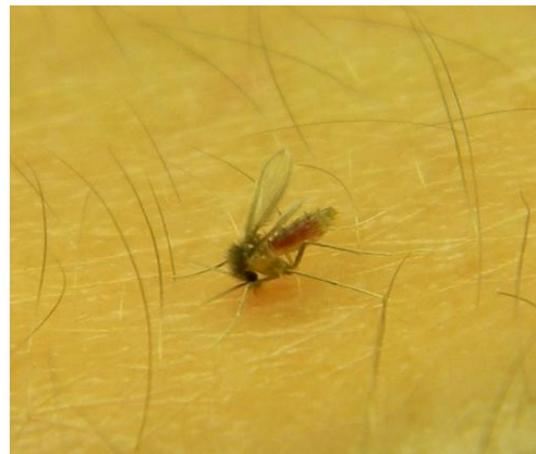
Figura 3. Microfotografía de Lutzomyia migonei realizando la hematofagia.”.

Por otra parte, la saliva del flebotomino