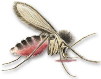
Figura 1. Diseño de flebotomino hembra sobre el hospedador mamífero.

flebotominos en el sistema inmune del hospedador (10-13).