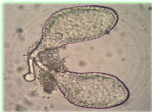
Figura 4. Microfotografía de las glándulas salivales de Lutzomyia migonei . 400X

El maxadilán es el vasodilatador más potente encontrado en la naturaleza, identificado en la saliva de L. longipalpis , a su vez incrementa la producción de IL6, IL4, IL10 y PGE2 y disminuye la producción de IL12, IFN- \gamma , TNF- \alpha y NO. La IL4 por su parte activa a los macrófagos, incrementa IL10 y la inosina, mientras