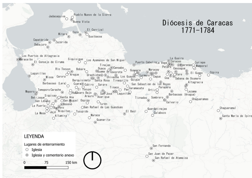
Figura 1. Mapa de la Diócesis de Caracas entre 1771 y 1784 con la localización de los lugares de enterramiento por tipo: iglesia y/o cementerio anexo (elaboración propia usando QGIS).

Esta distribución en la Diócesis de Caracas durante la visita pastoral del obispo Mariano Martí muestra un paisaje de lugares de los muertos que cambiará al finalizar el siglo, particularmente a partir de 1787. En esta fecha se promulga el decreto real de Carlos III sobre la prohibición de sepulturas dentro de las iglesias y la construcción de cementerios fuera de centros poblados en todo el imperio español. Las nuevas leyes iniciaron un cambio paulatino que se inició a finales del siglo XVIII y que se materializó bien entrado el siglo XIX. La normativa y su aplicación, que se dilató por múltiples razones políticas, religiosas y económicas serán examinadas en las siguientes secciones.