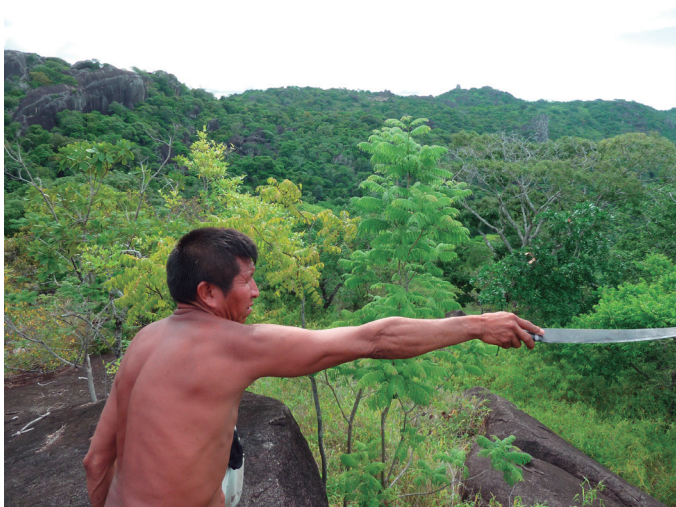
Figura 3. Expedición de toma de coordenadas, Temblador-Kiripipon. 12 de mayo de 2011.