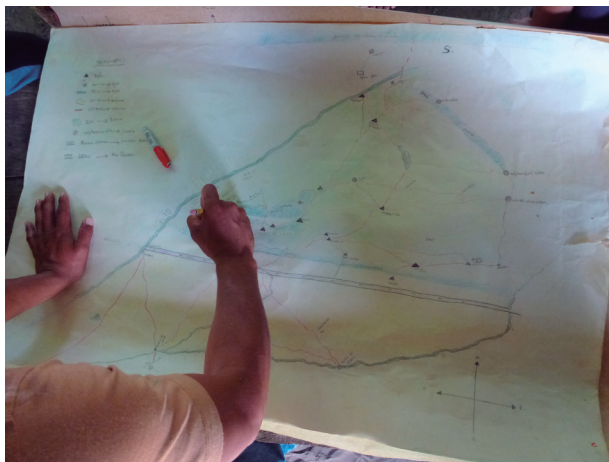
Figura 2. Dibujo del mapa de la comunidad de Corozal-Awankatan, 13 de mayo de 2012.

cartográfica entre los solicitantes, la intraducibilidad de ciertos conceptos, la gran extensión de territorio, el antagonismo entre sectores, las limitaciones de tiempo y, en general, la necesidad de aplicar criterios homogéneos.