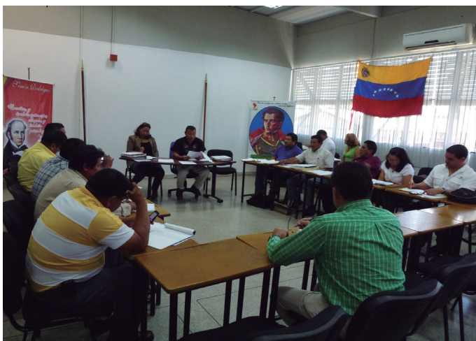
Figura 6. Reunión de la Comisión Regional de Demarcación del estado Bolívar, Ciudad Bolívar, 16 de febrero de 2012.

Venezuela dirigida al Vicepresidente de la República (Estudiantes de la Universidad Indígena de Venezuela, 2013). Con la denuncia del caso el plan queda frustrado. Desde estas fechas no ha habido avances significativo. La última reunión a la que asisto en Caracas, en agosto de 2013, con la CND y líderes indígenas de la FIEB, resulta tensa e infructuosa, y la FIEB insistirá a las comunidades que se reafirmen en la negativa.