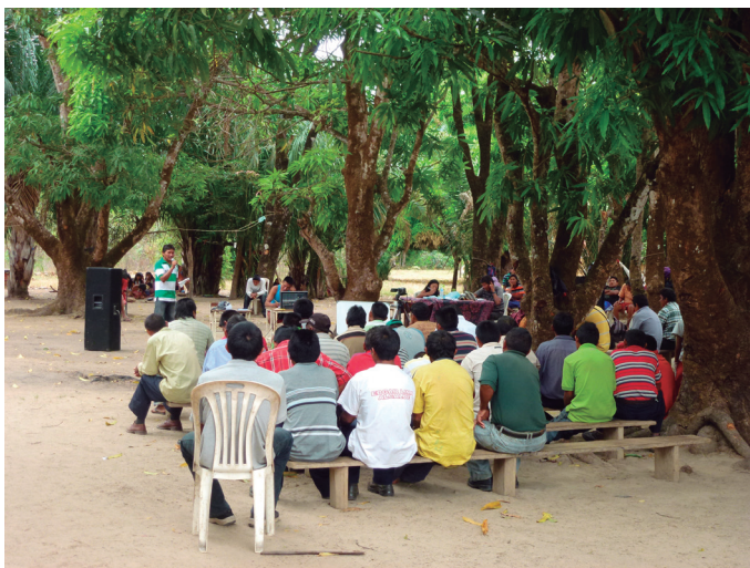
Figura 1. Asamblea constituyente del pueblo e'nyepa, Kuruwatan wuto - Colorado, 31 de enero de 2012.

considerado como un primer paso para poder reclamar derechos internacionales (Surrallés, 2009).