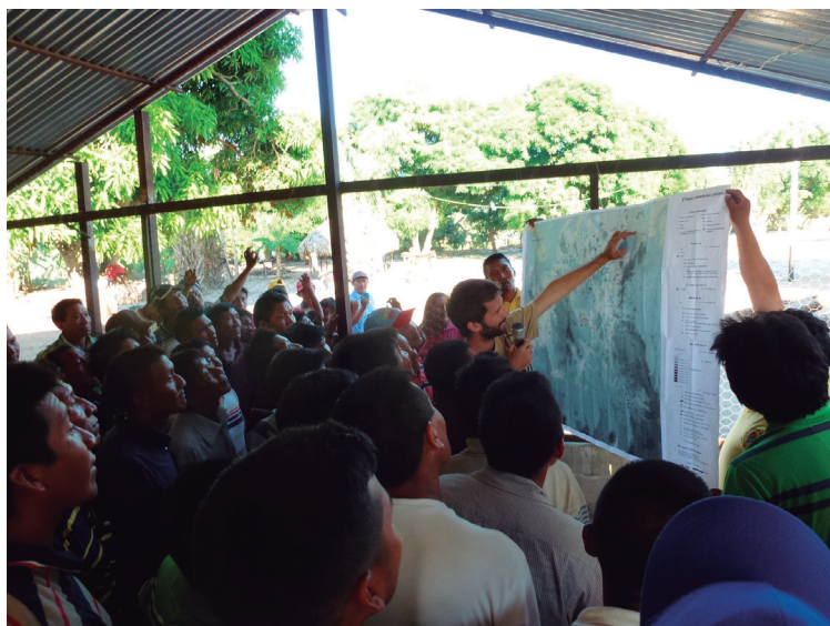
Figura 4. Presentación del mapa editado e impreso, Caicara del Orinoco, 16 de noviembre de 2013.

La fase de edición es, sin duda, la más larga y compleja. No solo es necesario encontrar y armonizar las capas raster y vectoriales que sirvan de base cartográfica, sino que también se deben integrar los miles de datos recogidos sobre el terreno de la manera más equilibrada posible. La selección de la información se hace en función de lo establecido en la leyenda y de los elementos más relevantes para la orientación según el saber local: cursos de agua, sabanas y relieve. Este ejercicio de traducción e interpretación intercultural requiere un esfuerzo por jerarquizar, tematizar, agrupar puntos, identificar coincidencias, aportar datos comprensibles desde la perspectiva de los conocimientos locales y los sistemas de clasificación vernáculos, e integrar elementos estéticos que definan el estilo gráfico y las técnicas figurativas. Todo esto debe hacerse respetando, a la vez, las prerrogativas del método científico.