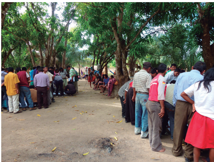
Figura 7. Reuniones por sector durante la asamblea constituyente del pueblo e'nyepa, Kuruwatan wuto - Colorado, 31 de enero de 2012

la leyenda en “territorios” patan y sus “habitantes” yaari (de agua tina yaari , de sabana wana yaari , de bosque i'pë yaari ) es un intento de integrar esta dimensión, bien conocida por la antropología antes de que el derecho lo concibiera. Cabe aclarar, sin embargo, que esta concepción inclusiva del territorio y esta innovación de la personalidad jurídica de los espacios de vida no fueron contempladas explícitamente como estrategia jurídica durante la demarcación, y es que tampoco se han dado este tipos de casos en Venezuela y no existe marco normativo o jurisprudencia que lo ampare, como sí sucede en Colombia o en Ecuador (Cf. Berros, 2024).