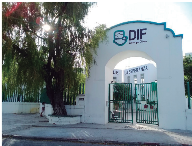
Figura 3. Albergue Infantil La Esperanza (AILE)

no tiene las condiciones básicas y de apoyo para desarrollar su trabajo de la mejor forma posible.