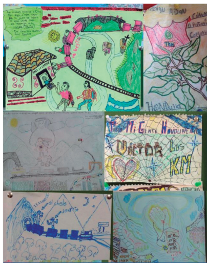
Figura 5. dibujos creados por niños migrantes en Tuxtla Gtz.

En el caso del Refugio Temporal para Niños y Niñas Migrantes No Acompañados en Tuxtla Gutiérrez, se ha identificado una carencia significativa en la provisión de educación formal. Este albergue, que acoge a niños y adolescentes de entre 2 y 17 años con 11 meses, no dispone de un docente de base. La falta de un profesional educativo conlleva serias implicaciones, dado que la enseñanza varía considerablemente según el grupo de edad, desde niños de 5 años hasta adolescentes de 14 años. La ausencia de un docente limita gravemente la capacidad de ofrecer una educación adaptada a los diferentes niveles académicos requeridos. Además, la sala asignada como aula se utiliza con frecuencia para mantener a los niños sin actividades educativas específicas, limitándose en el mejor de los casos a la entrega de material para colorear.