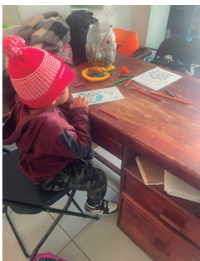
Figura 6. Fotografía propia tomada en el Refugio Temporal en Tuxtla Gutiérrez para niños y niñas migrantes no acompañados (RTNNA)

El psicólogo es designado por el DIF 6 Chiapas o incluso puede ser un voluntario, en ambos casos no se encuentra de planta en los albergues, asisten a estos espacios una vez a la semana, y atiende prácticamente y exclusivamente a niños que a simple vista tengan un problema, esto no es determinante, pero en el trabajo de campo realizado es lo que se ha observado.