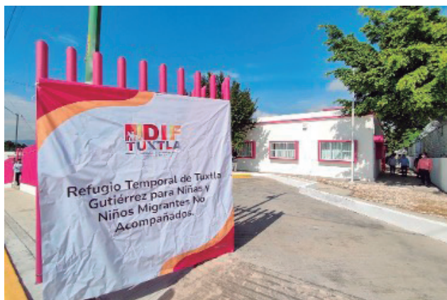
Figura 2. Refugio Temporal en Tuxtla Gutiérrez para niños y niñas migrantes no acompañados (RTNNA)

de enfoques en la atención y protección de los derechos de los migrantes. En este artículo vamos a enfocarnos en niños y niñas migrantes NNA bajo tutela. En la capital existen 2 centros de atención: el Refugio Temporal en Tuxtla Gutiérrez para niños y niñas migrantes no acompañados 1 (RTNNA), y el Albergue Infantil La Esperanza (AILE) 2 ambos centros de emergencia.