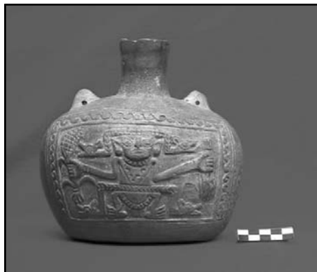
Ceramio B. N° de Registro: CE-0334.

El ceramio B (N° de Registro: CE-0334 Tunan-Paramonga) es un cántaro de manufactura moldeada, de color anaranjado, de técnica estampada y cocido en atmósfera oxidante. Presenta un cuello cóncavo - divergente con labio ojival. El cuerpo es elipsoidal y la base plana, posee dos apéndices perforados a manera de asas. El alto total es de 18 cms., el cuello una altura de 5 cms., el diámetro de la boca es de 4.6 cms., el ancho máximo del cuerpo es 16.2 cms., y la base una longitud de 12.6 cms. La decoración del ceramio está ubicada en el cuerpo anverso y reverso de la pieza. Presenta un plano único, de una figura masculina sujetando en ambas manos plantas y enmarcada por un ribete.