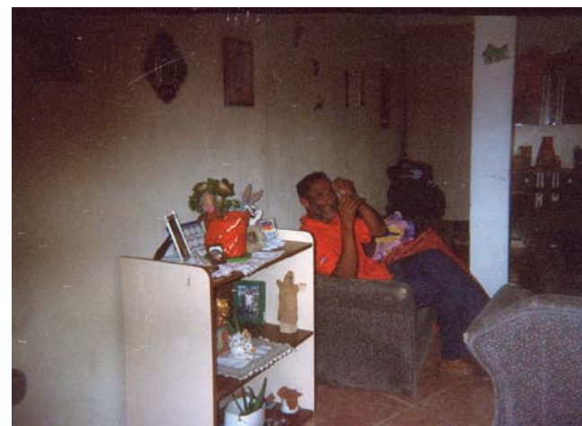
Fotografía 3. Figura paterna. Autor: Wilmes.

Los principales hallazgos de la investigación serán explicados desde la vivencia subjetiva descrita por los participantes en su discurso manifiesto (consciente) y, en segundo lugar, de esta vivencia subjetiva se pudieron inferir procesos que subyacen un discurso latente, la comprensión de un sentido inconsciente que estos jóvenes otorgan a sus actos. Partiendo de estos puntos esenciales, en la siguiente sección busco hilar ideas, acciones y consecuencias, que más allá de describirlas, trato de comprenderlas. A continuación, haré un muy breve resumen de contenidos ampliamente desarrollados en la publicación de la investigación, delimitando los procesos que conforman entonces una subjetividad que asume la violencia como forma de vida.