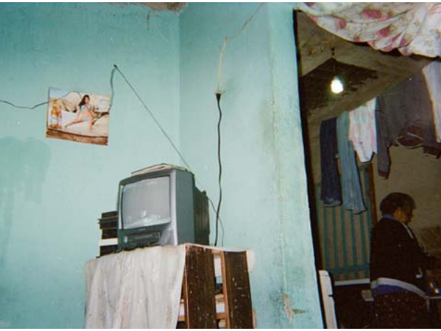
Fotografía 4. Abuela. Autor: Banban.