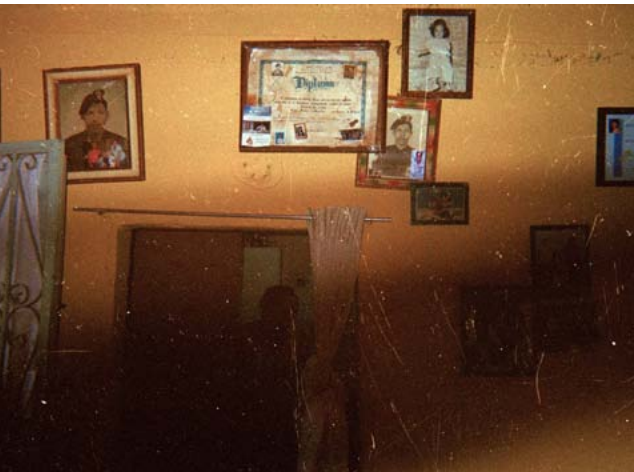
Fotografía 5. Abuela. Autor: Julián