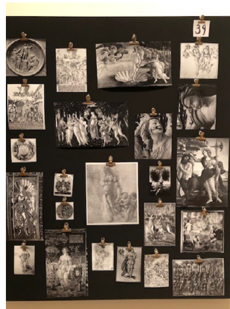
Atlas Mnemosyne, de Aby Warburg.

[...] Su trabajo sobre la Ninfa y sus accesorios, sobre todo lo relativo a los peinados y otros adornos, hablan de la importancia que tenían los detalles y cómo el seguimiento de estos podía llegar a explicar o dar cuenta de las conexiones históricas que había en determinadas imágenes y poder así caracterizar la continuidad que permitía [...]. (Campos, 2014, p.157)