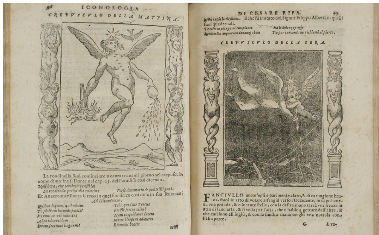
Iconologia de Cesare RIPA / (martayanlan.com)

Para la investigación, el estudio iconológico encuentra en Ripa uno de los antecedentes más importantes, en cuanto a narrativa fotográfica se refiere, donde se sustenta el entendimiento que del hombre ha realizado el mismo hombre, a través de sus formas y representaciones. Así pues, queda enmarcado el primer referente hacia el camino de la interpretación discursiva fotográfica del siglo XXI, en función de los elementos constitutivos de esta, partiendo de las alegorías y emblemas que se encuentran ocultas en el discurso fotográfico.