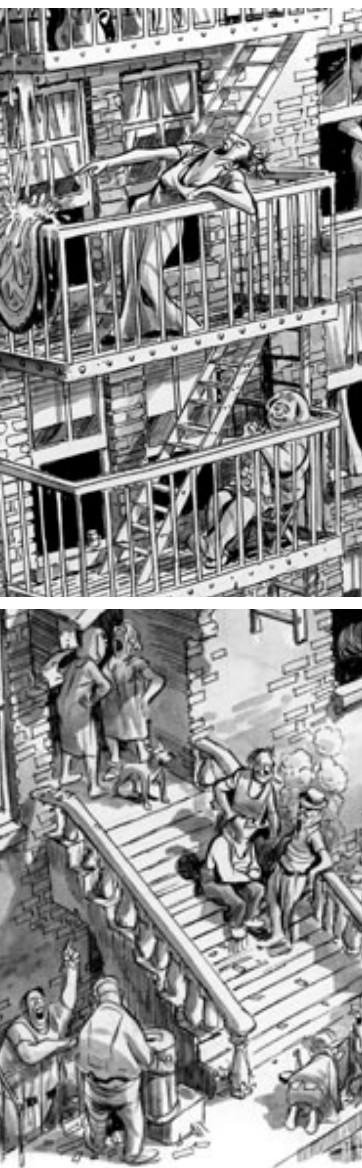
Fragmentos de “New York. The Big City”. Will Eisner.

De la misma manera, existen otros elementos sobre los cuales prestar especial atención en una fotografía, indispensables en la interpretación del cómic. Por ejemplo, hay que considerar el cuerpo humano o animal, como un conjunto dotado de cualidades y fronteras naturales con un rango de movilidad determinado, que bien pudieran dar un basamento esquemático de los acontecimientos plasmados en una imagen. Como tal el cuerpo, consta de una gama limitada de movimientos, por esa vía se pueden interpretar acciones y posibles desplazamientos dentro de una imagen, partiendo de lo que se conoce en cuanto a la movilidad y alcances anatómicos de los seres vivos.