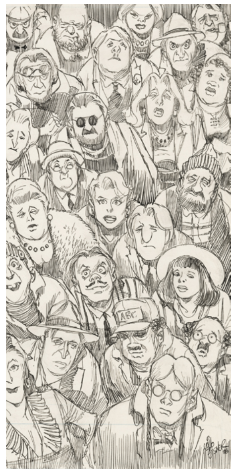
City People Notebook / Will Eisner Studios / theconversation.com

Para Eisner “[...] una “ imagen ” el recuerdo de un objeto o experiencia proporcionada por un narrador ya por un medio mecánico (fotografía), ya por un medio manual (dibujo)” (Eisner, 2017, p.15). El homologar desde el punto de vista discursivo en la imagen a los dibujos y a la fotografía, permite ubicar dentro