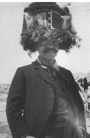
"Lightning in the wire" / D.L. Dusenbury addedusenbury.com

Debemos recordar que, si bien la teorización y la aplicación general del acercamiento psicológico fueron propuestas por Usener y por Lamprecht a finales del siglo XIX, ya en los años sesenta de la misma centuria Jacob Burckhardt observaba puntualmente que el saber artístico no es tanto una cuestión de estética como el estudio de aquello que sucede en el observador [...] Ernst Gombrich ha anotado justamente que Warburg se mantuvo durante toda su vida como seguidor de Lamprecht. Quedó, además, profundamente impresionado por el interés de Lamprecht en el problema de la transición de un periodo histórico a otro. (Warburg, 2005, pp.18-19)