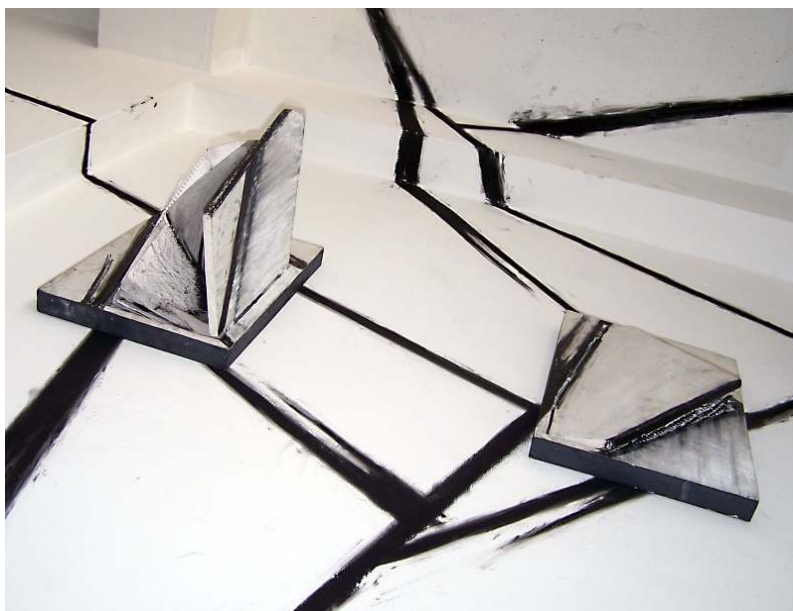
Carmen Ludene Líneas, surcos, espacios 2007 Mixta sobre pared (Libro de artista) Medidas variables

Esto enriquece las posibilidades pedagógicas de formar artistas gráficos en nuestra región con limitaciones institucionales y de infraestructura que a la larga se convierten en fortaleza, ya que los diferentes aspectos artesanales que brinda las diversas técnicas del grabado, incluso por presión manual y no por la acción mecánica de una prensa de grabado permite redimensionar la formación visual, adquiriendo matices que se apoyan en diversos recursos tecnológicos de reproducción que llevan al artista-docente a experimentar en las artes gráficas, técnicas artesanales y reproducciones que conjugan la fotografía, fotocopias, video, performances, carteles, entre otros recursos, que amplían la panorámica de una formación artística novedosa y basada en la experiencia de grupos reflexivos que se debaten entre el progreso de los medios de información y las tecnologías de impresión comercial, hasta la propuesta de artistas integrales capaces de transgredir el perfil laboral del medio gráfico para convertirlo en un medio de expresión estético que se direcciona hacia el mundo que brinda la alfabetidad visual en las artes visuales.