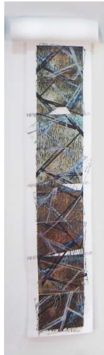
Carmen Ludene Desde un cilindro vi el rayo del Catatumbo (detalle) 2007 Grabado / cartulina 111.5 x 177 x 8.7 cm

En este desatino de oportunidades que es San Cristóbal, formamos artistas gráficos sin un referente apropiado a su formación visual, en diversos medios de los que se valen los artistas-docentes (dicentes, pedagogos) de una mención técnica que forma desde las diferentes especialidades gráficas de impresión a un cúmulo de jóvenes y voraces devoradores de imágenes con sus despliegues de plasticidad y emociones. Es la realidad de una región que por su condición topográfica gesta condiciones especiales para moldear en nuestros individuos el interés por los referentes visuales propios de la luz, las formas naturales, el clima y la multiplicidad de patrones culturales que permiten codificar y descodificar las exigencias y demandas del mercado visual propio de una región fronteriza donde, en su gran mayoría, la sociedad en común es analfabeta visual.