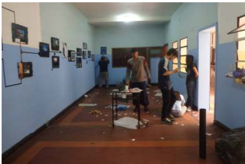
Montaje de la exposición: "Conjeturando realidades" en la Fototeca del Táchira

Keywords: pedagogy practice, graphic arts, artists in training, cultural hybridization.