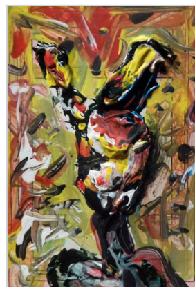
Ender Rodríguez / Miniaturas de la serie Bestiario 2023 / acrílico sobre barajas de cartón / 11,5 x 7,5 cm