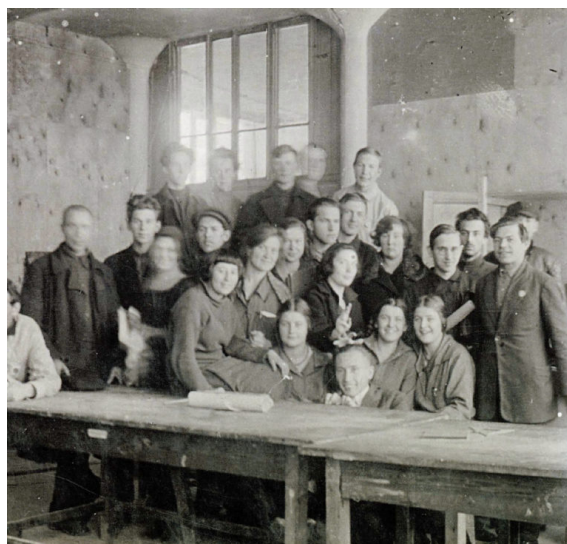
Figura 3. Primera generación de estudiantes en clase de madera, N. Kolpacova, 1926.