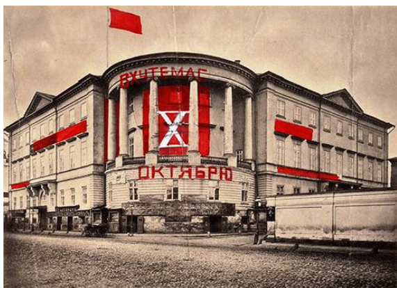
Figura 2. Edificio que ocupó VKhUTEMAS en la calle Myasnitskaya, Moscú.

Estas disputas llevaron a la intervención de los Estudios Libres donde los artistas constructivistas tuvieron la tarea de generar una nueva cara política a los estudios del arte y es así como se crea definitivamente en 1920 los VKhUTEMAS, que son los Talleres Superiores Artísticos y Técnicos del Estado (ver figura 2)