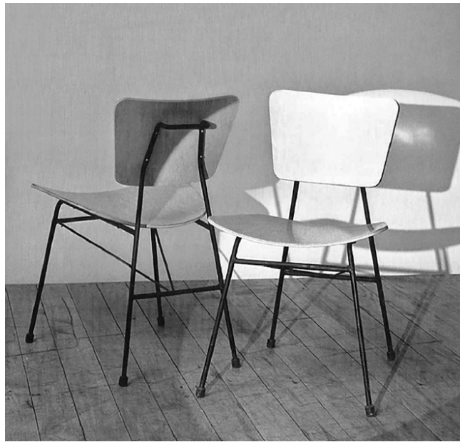
Figura: Silla con estructura de barras y contraenchapado (n.º 58, 1952). Cornelis Zitman. Catálogo de ventas n.º 1. Tecoteca muebles C. A. Caracas: Cromotip.

La historia de la cultura del diseño no solo exige una aproximación a los procesos de la materialidad y la circulación, sino también obliga a un análisis prudente de los discursos historiográficos, la relación entre la historia del diseño y la de la sociedad misma, y el empleo de idóneas fuentes documentales, entre otros aspectos. En ese contexto, la investigación y revisión bibliográfica es fundamental, no solo para asegurar el rigor necesario, sino para disponer una serie de elementos que beneficien los procesos de otros investigadores, incluyendo aquellos que apenas inician su formación.