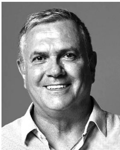
Fig. 7: Fernando Campana

El 16 de noviembre de 2022 murió a los 61 años el arquitecto y diseñador brasileño Fernando Campana (figura 7), quien junto a su hermano Humberto trabajó, bajo una creativa conciencia ecológica, gran variedad de piezas de mobiliario, indumentaria y joyería que han transgredido los límites entre arte, artesanía y diseño. En su "caos creativo" impulsado por la idea de transformación y reinención, le gustaba proyectar, seleccionar materiales comunes y desechados, reciclar objetos cotidianos, rescatar técnicas artesanales locales o regionales, mientras su hermano, además de proyectar, le gusta el hacer, involucrase directamente con los materiales. Entre sus piezas más icónicas figuran la Silla Vermelha (1993), la Nuveum Collection (2006) y el Sofá Cocoon (2022), por nombrar algunas.