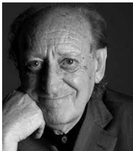
Fig. 6: Joan Costa

El mundo del Diseño Gráfico también se vio afectado por la partida del diseñador, sociólogo, consultor e investigador badalonés Joan Costa (figura 6), el 24 de noviembre de 2022, a los 96 años. Autodidacta e interesado en los fenómenos de la comunicación, concibió el diseño como lenguaje gráfico cuya eficacia radica en la capacidad del diseñador de concebir un mensaje gráfico que “atraiga y active la atención del espectador y éste extraiga la información de manera agradable y rápida”. Desarrolló áreas como la señalética y el branding, publicando más de cuatro decenas de libros como La Imagen y el impacto psicovisual (1971), Señalética corporativa (2007) y Los 5 pilares del branding. Anatomía de la marca (2013), junto a centenares de artículos y su columna quincenal “A costa mía” en la revista española de diseño Experimenta .