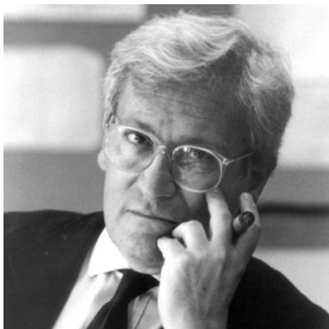
Fig. 1: Oriol Bohigas Guardiola