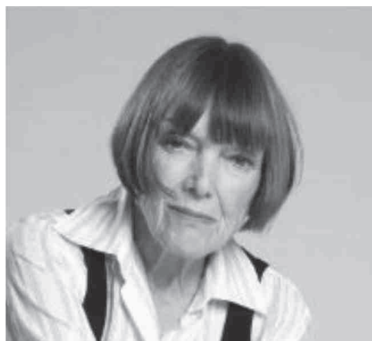
Fig. 11: Mary Quant

Y el 13 de abril de 2023 murió a sus 93 años la diseñadora de indumentaria y cosméticos londinense Mary Quant (figura 11), quien con su espíritu rebelde y desafiante revolucionó la moda femenina en la década de los sesenta al popularizar prendas cada vez más cortas: la minifalda, el vestido de punto, los pantalones muy cortos, las medias pantis con patrones y colores vibrantes. La libertad de sus diseños propugnaba la diversión asociada a la juventud, a la independencia femenina. Y además de fundar su boutique Bazaar en 1955, estuvo a cargo de su propia línea de maquillaje (1966), del diseño de pieles, calzado, lencería para el hogar y monturas de anteojos.