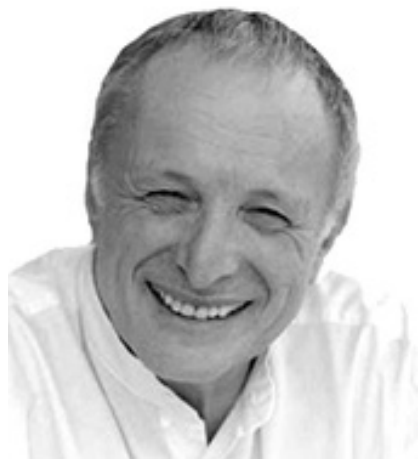
Fig. 2: Richard George Rogers

El 14 de enero de 2022 murió a sus 82 años el arquitecto y urbanista barcelonés Ricardo