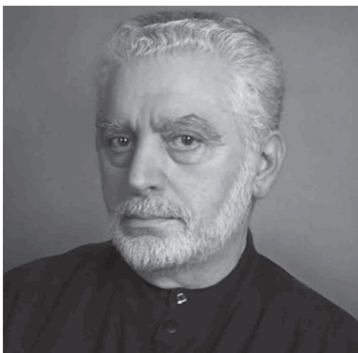
Fig. 10: Paco Rabanne

con técnicas y materiales no convencionales como metales, papel, plásticos y neopreno, generando así propuestas disruptivas en cuanto a formas, colores y texturas. No solo se dedicó al diseño de alta costura, sino que también creó accesorios y bisutería; incursionó en el mundo de los perfumes –diseñando incluso algunos de sus frascos, como el de Ultraviolet (1999)–, mobiliario y vestuario para obras cinematográficas como Barbarella (1968). Incluso, publicó varios libros, entre ellos la Trayectoria del mundo de la moda (1992).