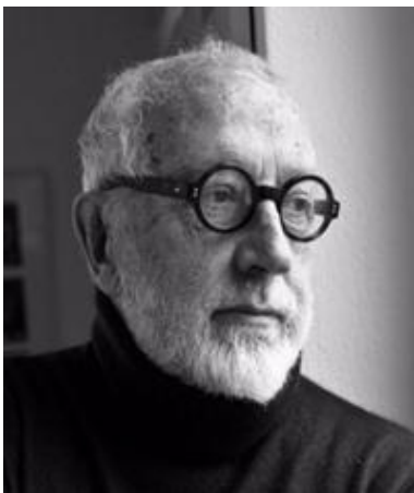
Fig. 9: Andrea Branzi