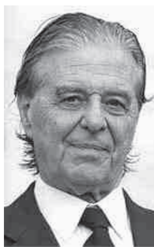
Fig. 3: Ricardo Bofill Leví

Bofill Leví (figura 3), maestro del postmodernismo español, en cuyo "Taller de Arquitectura" -equipo multidisciplinario compuesto por ingenieros, sociólogos, artistas, matemáticos, etc.-ejerció una práctica respetuosa por las necesidades de los habitantes, el pasado histórico, la tradición del lugar y el impulso hacia las nuevas tendencias, desarrollando un estilo ecléctico donde hizo referencias al Brutalismo, al Clasicismo y al Futurismo. Entre sus proyectos más emblemáticos están el Barrio Gaudí (1968), La Muralla Roja (1973) y Les Espaces d'Abraças (1983).