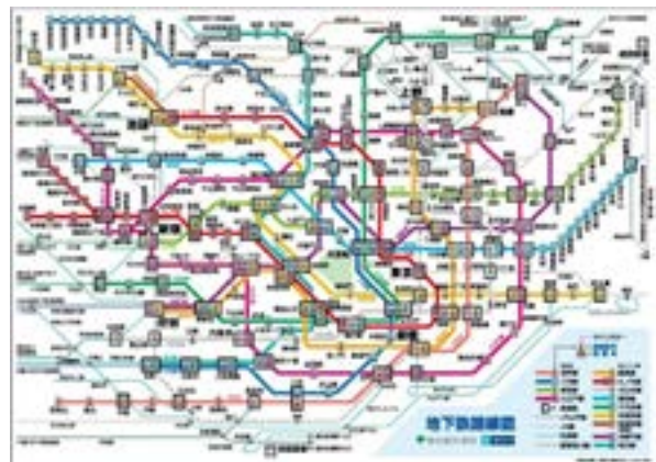
Figura 4. Mapa de la red del Metro de Tokio

Tokio posee actualmente una población, en lo que puede considerarse como la zona central, que supera los 13 millones de habitantes. El centro de Tokio, con sus 23 barrios, ocupa un tercio de la metrópoli. Esta es la zona que se conoce como la ciudad de Tokio. En el área metropolitana transitan más de 36 millones de habitantes, lo que la convierte en la segunda mayor aglomeración urbana del mundo, después de Cantón (China). La red del metro se articula y extiende sirviendo a otras áreas urbanas no centrales y, sobre todo, como una red de transporte conectada a otros sistemas de comunicación urbanística. Este último es un aspecto importante a la hora de observar, analizar y comprender mejor las coreografías, movimientos, posturas y uso de dispositivos de la gente que día a día hace uso del metro y de sus instalaciones (Fig. 4).