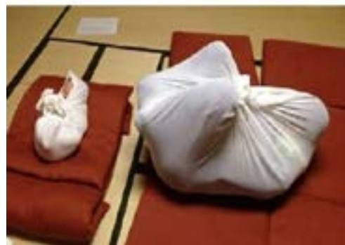
Figura 8 y 9. Otonomaki. Una nueva terapia corporal para la restauración del tono y de la postura