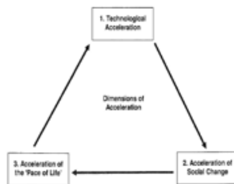
Figura 6. Esquema del sistema del ciclo de aceleración en el cual la aceleración tecnológica tiende a controlar o pilotear la aceleración de la vida cotidiana y la aceleración de los cambios sociales .

Nuestro cuerpo y el cuerpo social, individual, en grupo o en masa, es una maravillosa potencia de signos antiguos y nuevos. Una fuente de posibles ajustes recíprocos con las tecnologías, re-nacimientos y devenires. Sobre todo, como en este caso de la cultura urbana japonesa, de la simbiosis entre cuerpo, tecnología, cultura y sociedad civil. En este sentido siempre nos ha asombrado la capacidad de los cuerpos sociales de resistencia y de creatividad al mismo tiempo. En pocas palabras: la casita efímera de un homeless no es solo el indicio de pobreza y de inequidad social sino también y sobre todo, un signo profundamente humano de creatividad y de lo que los arquitectos y diseñadores de los años setenta denominamos como diseño espontáneo, de patterns y soluciones para crear espacios de resguardo para el cuerpo, aún en los entornos más hostiles y tecnológicamente fríos (Alexander 1978, Mangieri 1980,