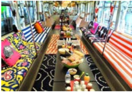
Figura 11. Vagón-relax. Subway de Tokio.