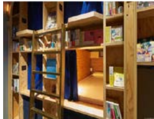
Figura 10. Hotel-cápsula y librería, Tokio.