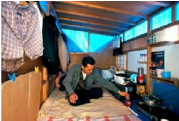
Figura 7. Homeless en la estación Shinjuku del subway de Tokio.

2012, 2017). Además, y hacemos énfasis en esto, estas soluciones de "emergencia" parecen basarse en códigos, ritos sociales y discursividades de larga duración histórica (el cobijo, el nido , los lugares para aislarse y restaurar el cuerpo, la distancia necesaria con el mundo) (Fig. 7).