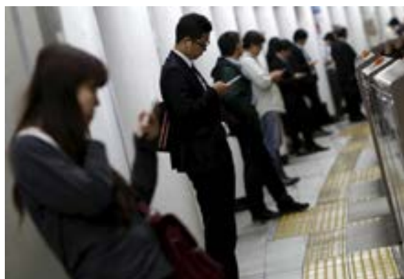
Figura 3. Esperando el vagón del subway