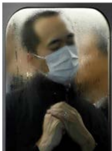
Figura 1 y 2. Tokio compression