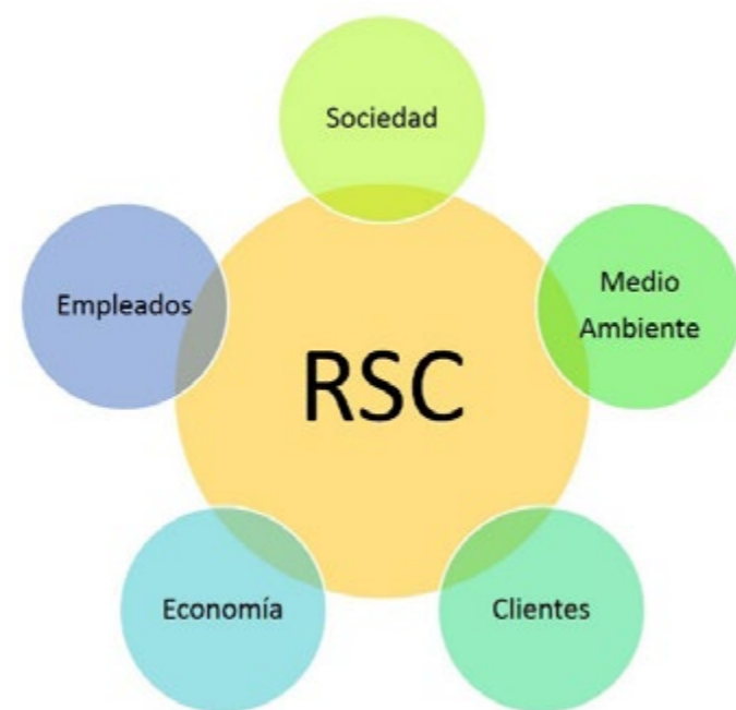
[Fig. 1] Principios en los cuales se fundamenta la Responsabilidad Social Corporativa (RSC).

Finalmente en el capítulo "Ahorro energético" profundiza sobre los recursos energéticos. Estudia los distintos métodos de obtención energética. Igualmente puntualiza, como el ahorro de energía es la mejor solución, planteando ideas para que ello se pueda conseguir en el hogar, el lugar de estudio y trabajo.