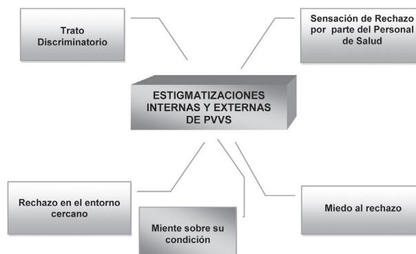
Gráfico N° 1. Categoría central y categorías emergentes

Se determinó la categoría o concepto central como Estigmatizaciones Internas y externas de las PVVS, ya que todas las expresiones narradas por los informantes dan cuenta de las distintas formas de sometimiento al rechazo y la discriminación así como también a su percepción personal sobre el VIH.