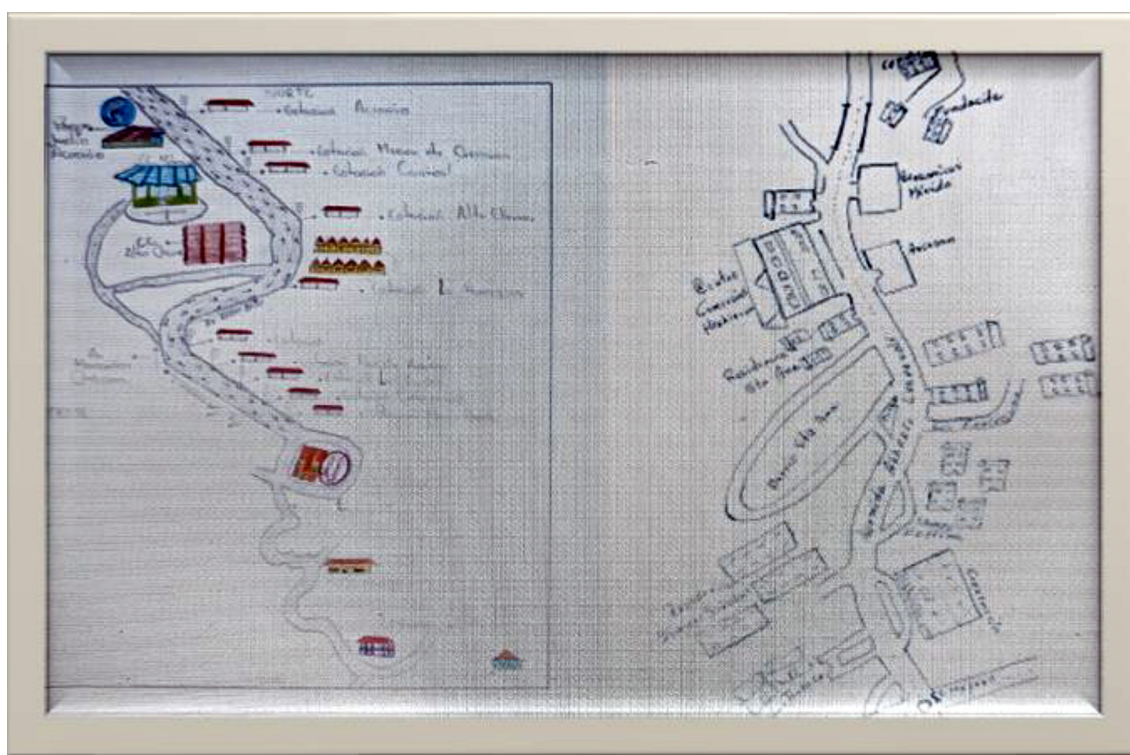
Ilustración 2. Rutagrama de Caremis y Marielinda