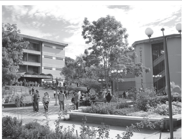
Facultad de Humanidades Universidad de Los Andes Mérida - Venezuela