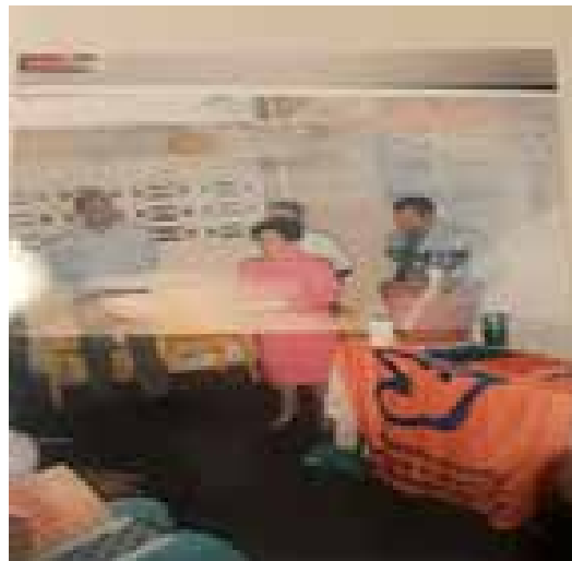
Figura 8. Reconocimiento de FUNDARIBAS, 2007

2007, julio 6. Durante otro acto de egreso recibí un significativo reconocimiento de los usuarios de FUNDARIBAS por “el excelente aporte a la modalidad ambulatoria y hospital día, siendo baluarte fundamental en la experiencia y en la enseñanza de apoyo a pacientes o adictos, con su amor responsable y sentido de pertenencia” (Figura 8).