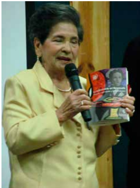
Figura 15. Madrina del Libro “La enfermería en Venezuela. Historia, organización y lucha colectiva”, 2011.

2011, noviembre 17. En el citado evento, me nombraron Madrina de la Obra Inédita titulada “La enfermería en Venezuela. Historia, organización y lucha colectiva” 3 (Figura 15). En el contenido de este texto resalta el inicio y desarrollo de la Enfermería venezolana, la Enfermería comunitaria y gremial hasta la etapa de profesionalización en las distintas universidades del país.