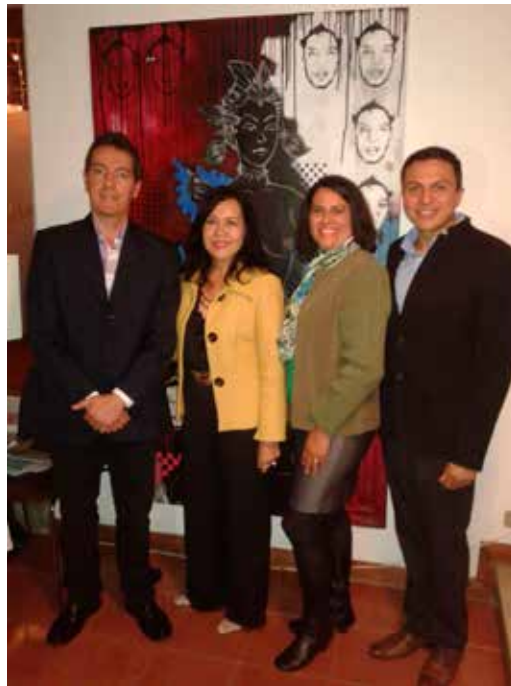
Figura 14. Grupo de Investigación Historia y Pensamiento Enfermero, 2011.

2011, noviembre 17 y 18. Con la ponencia “Enfermería en el Sistema de Salud Venezolano: 1936-2000”, participé en el “I Evento Nacional sobre la Historia de la Enfermería Venezolana”, organizado por el Grupo de Investigación Historia y Pensamiento Enfermero y el Seminario Permanente para la Investigación de la Historia de la Enfermería Venezolana de la Escuela de Enfermería de la ULA (Figura 14).