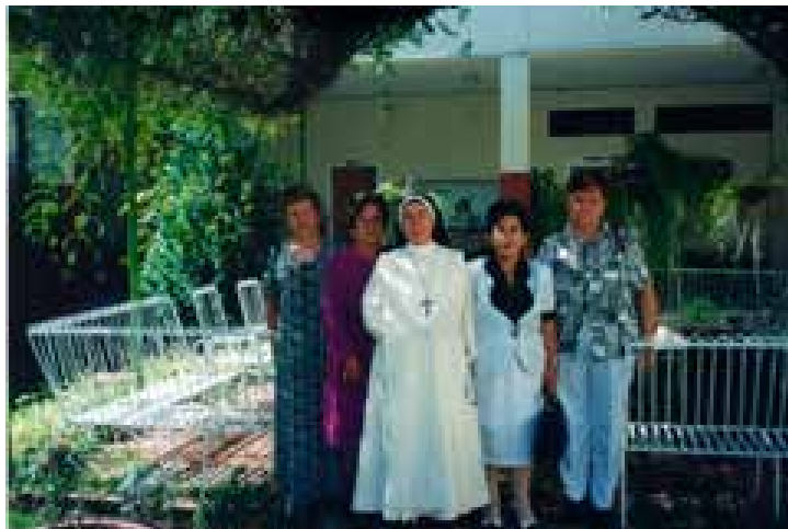
Figura 3. Junta Directiva de la AENJUVE, 1998.