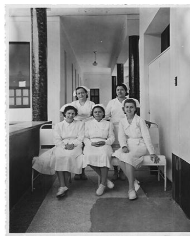
Figura 1. Amadora (sentada en el centro) con compañeras de trabajo en Coro, Hospital "Antonio Smith". 1949.

Al regresar a Coro (capital del Estado Falcón), fue nombrada Jefe de Enfermeras del hoy desaparecido Hospital "Antonio Smith", donde aparte de las actividades propias de la jefatura correspondiente, se ocupó de una serie de funciones, desde la prestación de cuidados directos a los pacientes hasta la instrumentación en las operaciones quirúrgicas que se realizaban (figura 1).