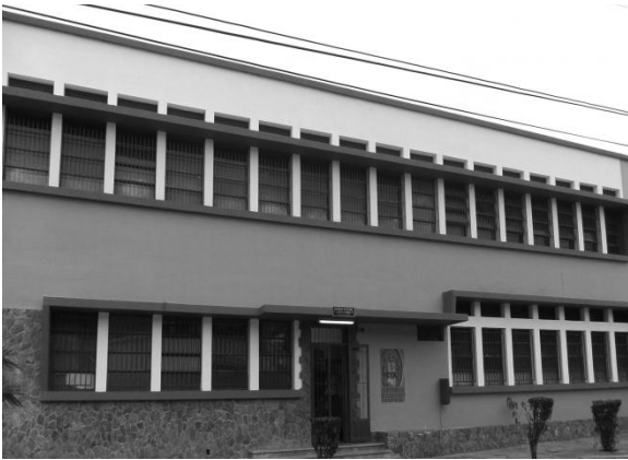
Figura 5. Escuela de Enfermería de la Universidad de Los Andes, creada el 10 de Marzo de 1967.