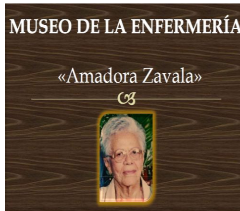
Figura 9. Museo de la Enfermería "Amadora Zavala". 2012.