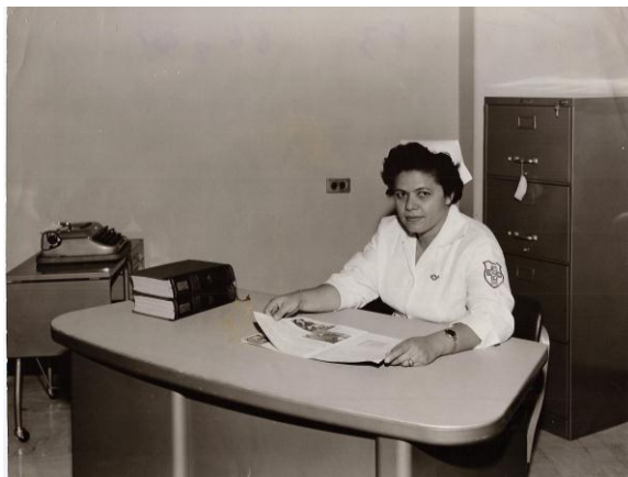
Figura 2. Escuela Nacional de Enfermeras de Caracas. Amadora en la Oficina de la Dirección. 1958.

Trabajó cuatro años en Coro, pues en el año 1952 se trasladó a la ciudad de Valencia para ocupar el cargo de Jefe de Enfermeras de la Maternidad del Hospital Central. Más tarde aceptó un cargo de docente en la Escuela Nacional de Enfermeras en Caracas, en la cual se encargó como Directora desde 1958 hasta 1962 (figuras 2 y 3).