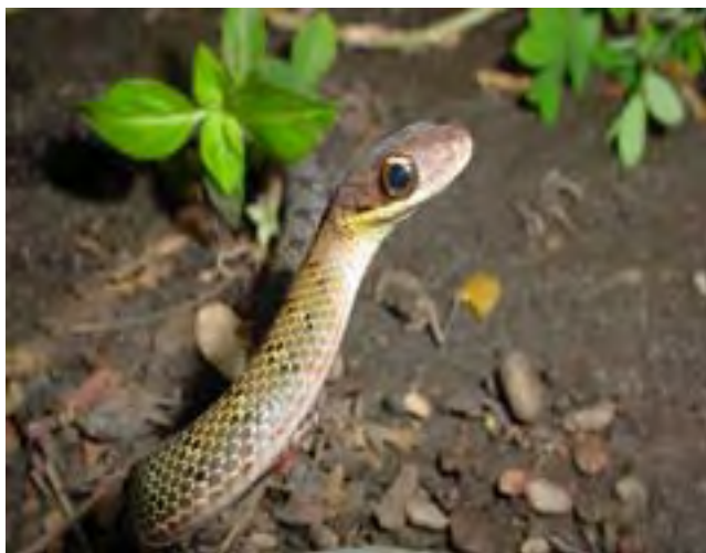
FIG. 2. Dendrophidion nuchale , juvenil. Chivacoa, estado Yaracuy. Nótese las escamas dorsales débilmente quilladas.

Dendrophidion nuchale , juvenile. Chivacoa, Yaracuy State. Note dorsal scales slightly keeled.