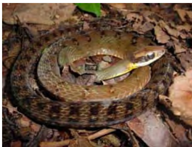
FIG. 3. Dendrophidion nuchale , adulto, Hacienda Picachito, Monumento Natural Cerro Platillón. Nótese la primera hilera de escamas dorsales lisas.

Dendrophidion nuchale , adult, Hacienda Picachito, Monumento Natural Cerro Platillón. Note first row of smooth dorsal scales.