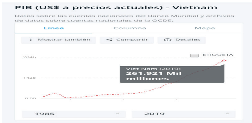
GRÁFICO 1: PIB DE VIETNAM 2019 (USD A PRECIOS ATUALES)