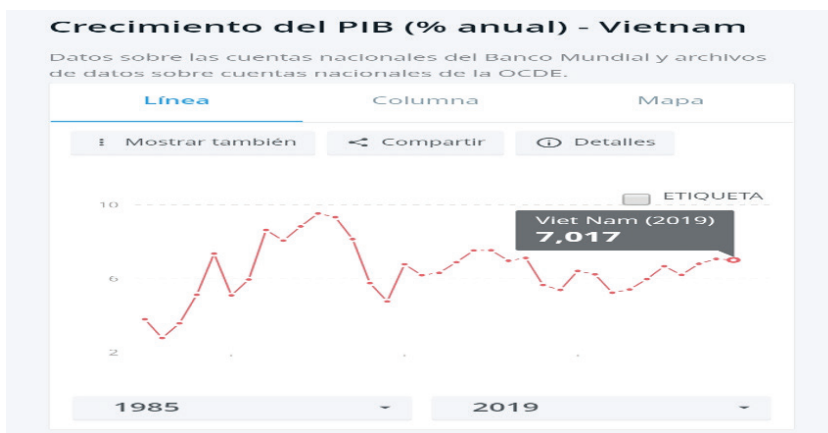
GRÁFICO 2: CRECIMIENTO DEL PIB (% ANUAL) DE VIETNAM (2019)