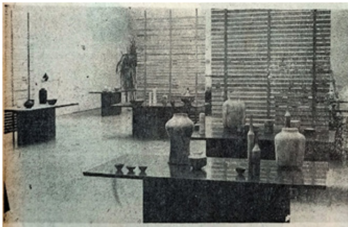
Fuente: Vista de la exposición “Del Pierre-Hamada-Leach,” 22 de abril de 1966. Fuente: Diario El Nacional , “Hoy Inauguran en el Museo Exposición de Cerámicas.” 8 (132 - Año XXIII), C-10.