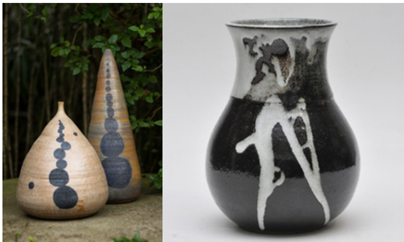
Fuente: (izquierda) Shoko Suzuki. De la serie Campo . Fotografía © Felipe Costa (FELCO). (derecha) Míeko Ukeseki, Jarrón de cerámica esmaltada y vitrificada en tonos ocre oscuro y blanco.