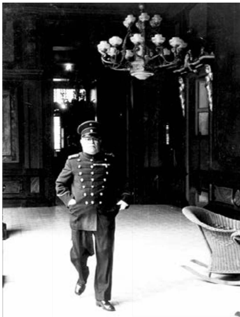
Figura 2: Pedro Elías Gutiérrez, circa 1930. Mendoza y Viña (2015) Banda Marcial Caracas, 150 años de tradición. (p.135)

Entre y durante el largo periodo del Maestro Pedro Elías Gutiérrez, la Banda Marcial Caracas realizó sus primeras grabaciones, con la casa Víctor Talking Machine, distribuidores de los famosos, discos Víctor de 10 pulgadas, también conocidos como discos de 78. Según la descripción disponible en el catálogo en línea de la Discography of American Historical Recordings (DAHR), la grabación fue llevada a cabo el día lunes 29 de febrero de 1913 (p. 23).