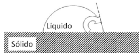
Figura 3. Ángulo de contacto de una gota de líquido sobre una superficie sólida. Tomado de Winkler S, Ortman H, Ryczek M 10 .

La humectabilidad de un sólido por un líquido es determinado por la medición del ángulo de contacto entre una gota de líquido y la superficie plana del sólido 21 , Figura 3. Este ángulo es característico de las sustancias en el sistema debido a la tensión superficial del líquido y la energía superficial del sólido, modificada por ciertas propiedades, tales como la aspereza. Un ángulo de contacto bajo indica buena humectabilidad mientras que un ángulo de contacto alto resulta en pobre humectabilidad. En consecuencia, la retención se incrementa cuando la dentadura se vuelve más humectable 10 .