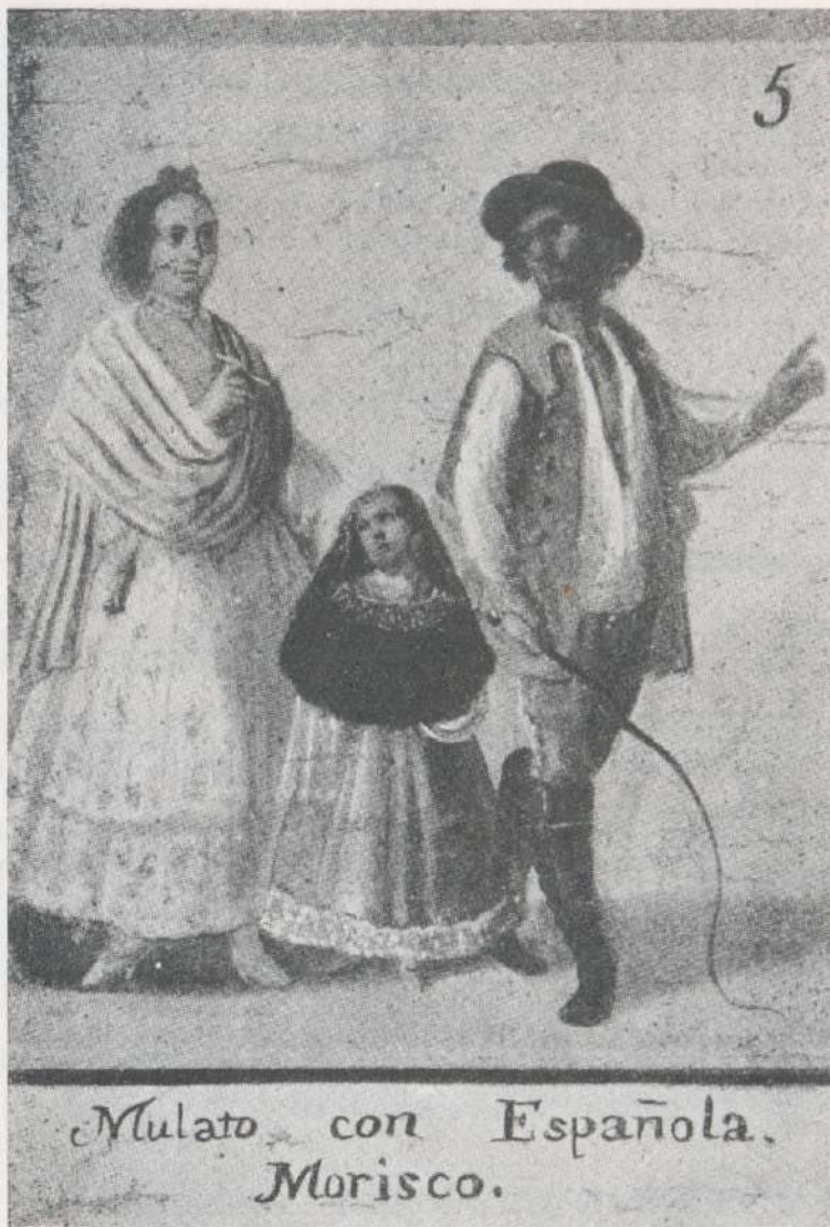
Cuadro de Mestizaje. Tomado de Angel Rosenblat. La Población Indígena y el Mestizaje en América . Buenos Aires, Editorial Nova, 1954, t. II, p. 173.