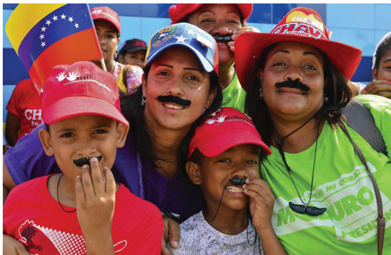
Imagen 8. Simpatizantes en acto de campaña [Internet]. 2013 [citado 7 de febrero 2023]. Disponible en: https://ep00.epimg.net/internacional/imagenes/2013/04/12/album/1365793689_920268_1365796025_album_normal.jpg

Visto también en la necesidad de crearse una simbología propia -el sobrevivir adaptándose a la del caudillo militar tiene un alcance limitado-. Pues, en las elecciones de 2013 se hace un rudimentario (por lo tosco y poco preparado en relación con los símbolos que utilizaba Chávez) acercamiento a identificarse con el pueblo con la figura del bigote. Dos momentos propagandísticos sobreviven a la par: el rojo característico desde 1999, y, el bigote del nuevo líder del partido (ver imagen 8).