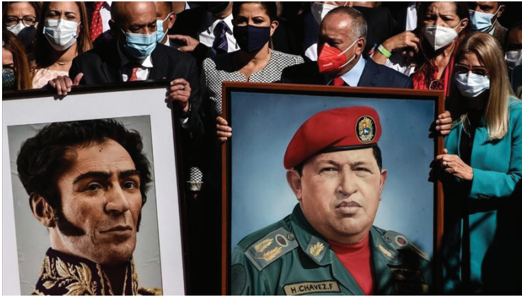
Imagen 5. Agencia Anadolu. Cuadros de Bolívar y Chávez en la Asamblea Nacional [Internet]. 2021 [citado 28 diciembre 2022].

De entrada, se observan paralelismos con presidentes militares: Pérez Jiménez, sobre todo en lo tocante a la figura del líder (caudillo) como eje central de la imagen (imagen 5). Pero se le añade, además, la nostalgia independentista, equiparando al caudillo Hugo Chávez con el padre de la patria (Bolívar).