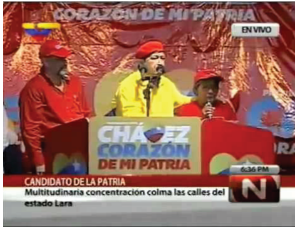
Imagen 6. Youtube. Discurso de Hugo Chávez en campaña (VTV) [Internet].

2012 [citado 28 diciembre 2022]. Disponible en: https://www.google.com/url?sa=i&url=https%3A%2F%2Fwww.youtube.com%2Fwatch%3Fv%3D4wXCldHY5kY&psig=AOvVaw1x_iNUUNOAHhF8BkucfKm&ust=1672319685825000&source=images&cd=vfe&ved=0CBAQjRxxqFwoTCIiyhrmynPwCFQAAAAAdAAAAABA2