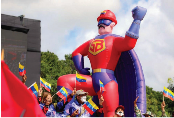
Imagen 11. Noticias A Simple Vista. Inflable Marcha Chavismo [Internet]. 2022 [citado 28 diciembre 2022]. Disponible en: https://www.asimplevista.com/wp-content/uploads/2022/07/super-bigote-1410x793.jpeg

realidad en la psiquis social, y así distorsionar la percepción de la Historia de Venezuela. La misión de los científicos sociales, hoy en día, es estar atentos con su presente y deconstruirlo.