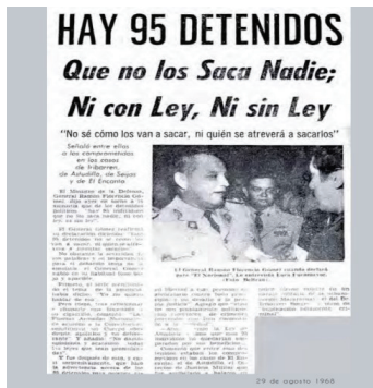
Imagen 2. Ibidem , p. 65.