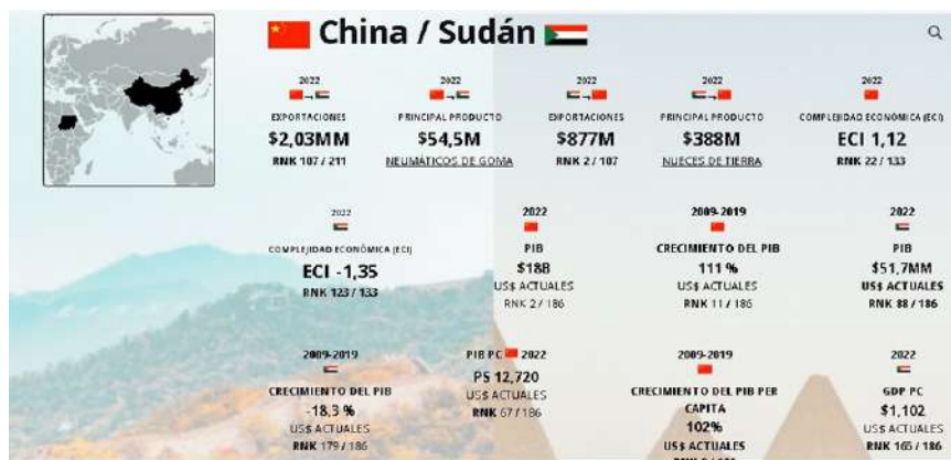
Figura N° 4. Relación comercial entre China y Sudán en el año 2022