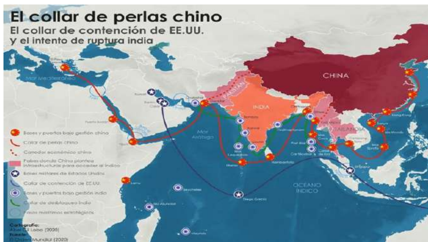
Figura N° 2. El Collar de Perlas Chino

a ellos, al mismo tiempo hay una “carrera internacional por la seguridad en África”. 21 Acerca de esto último, el investigador Macharia Munene considera tres razones por las cuales a esta región se le dificulta conseguir la paz: a) rivalidades internas; b) organizaciones terroristas; y c) dependencia de grandes potencias para diversos temas, incluidos la seguridad. 22 Lo que coloca a este continente en el foco geopolítico y geoestratégico.