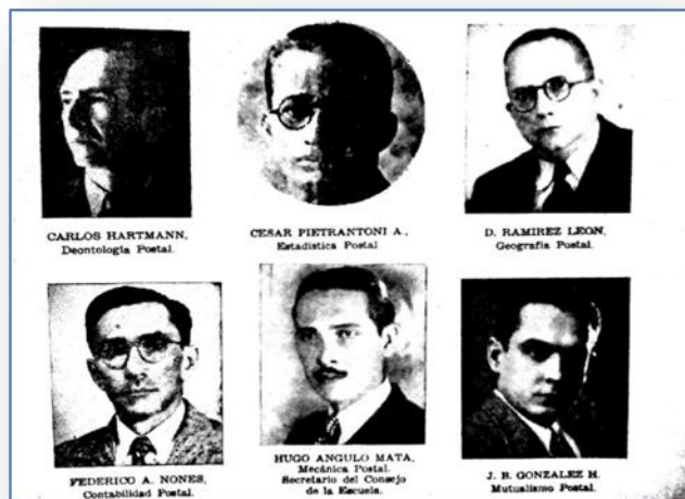
Fig. 4. Profesores de la Escuela Postal Venezolana

La Escuela Postal tuvo un impacto transcendental en la profesionalización del servicio postal en Venezuela. Este Instituto que venía funcionando en el segundo piso de la Central de Correos, esquina de Las Carmelitas, se trasladó a un local propio situado entre las esquinas Altagracia y Mijares No 2-1 36 . En estas instalaciones se fundaron como bases para la formación del personal para el mejoramiento del servicio para el público, el fortalecimiento de la institución postal y adaptarse a las nuevas formas de tecnologías de la comunicación para una mejor eficiencia de las funciones postales,