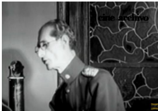
Fig. 1. Eleazar López Contreras en la Radio, 1935.

cuando algunas organizaciones políticas continuaron proponiendo programas de mayor democratización política y económica para el país. En todo, el “Programa de Febrero” fue el primer gran proyecto de reformas del Estado moderno en Venezuela. 8