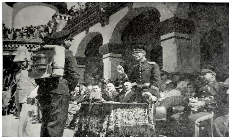
Fig. 3. Visita de Eleazar López Contreras a la Escuela Militar.

Por otra parte, la correspondencia militar mediante cartas, telegramas e informes, precisaba una comunicación directa dentro de la organización interna del Ministerio de Guerra y Marina, a través del canje de información sobre temas referentes al servicio militar, coordinación interinstitucional, logística de las operaciones, resultados de la formación del personal militar, entre otro ejemplos, tal como se concibe en la siguiente muestra (fig.3).