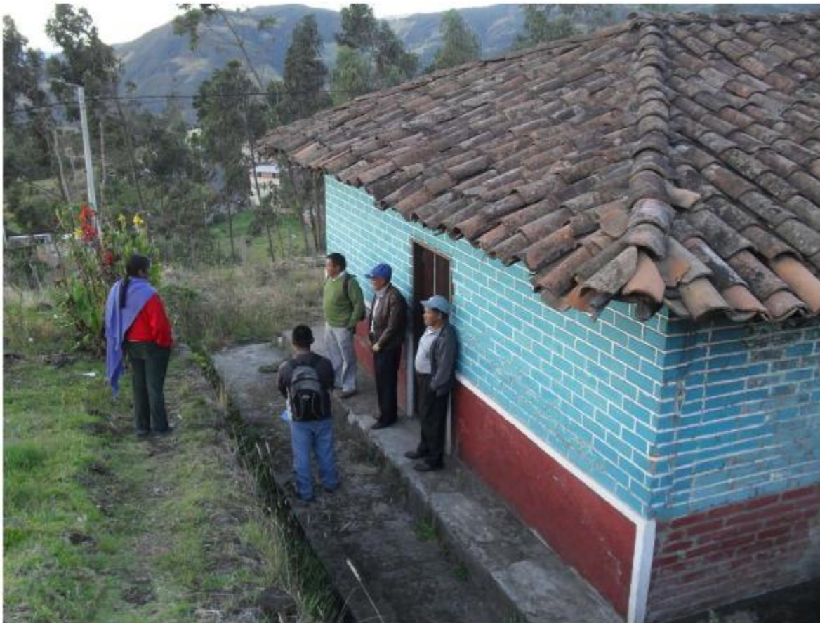
Comuneros de Jenoy. Consejo de Mayores Septiembre de 2013