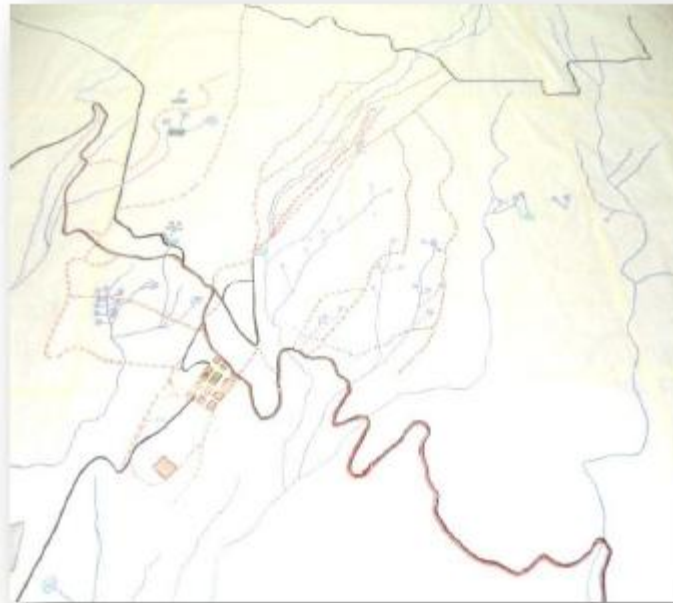
Mapa del agua: Jenoy.