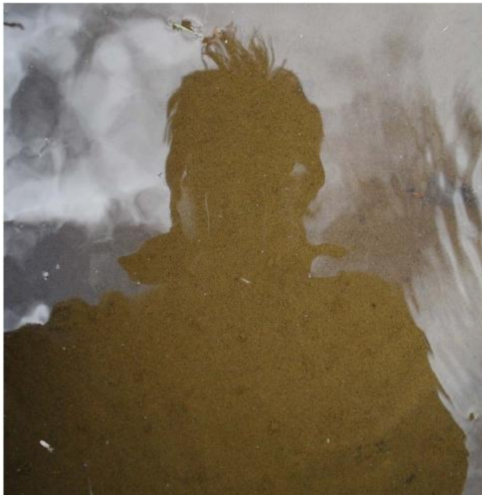
Espejo de agua ***. Jenoy, 23 de febrero de 2013