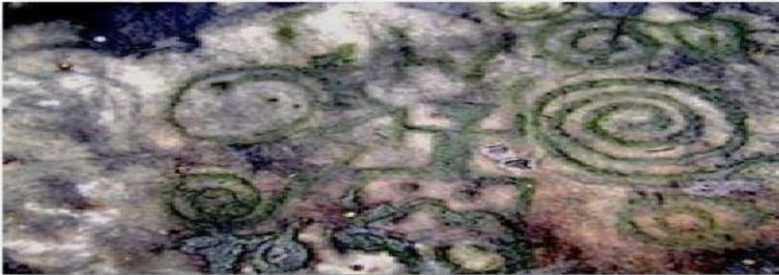
El Mantel de Piedra 40

misma forma, los grandes ríos que atraviesan las ciudades copian las propiedades de la enfermedad humana contemporánea, y aunque corran hacia el océano, su velocidad es la de la muerte, cargada de escombros y detritus de toda índole. Una propuesta de lo jurídico para los tiempos del desprecio que corren y nos acercan al abismo de la destrucción planetaria, debe encaminarse hacia lo que ha dado en llamarse las lógicas del buen vivir, que algunos pueblos originarios ponían en práctica y que hoy por hoy son el norte de sus discursos de reconstrucción histórica en muchos pueblos. Esas lógicas, para lo jurídico, tienen una perspectiva que altera por completo los conceptos sobre los cuales se han asentado los proyectos de estados en el mundo.