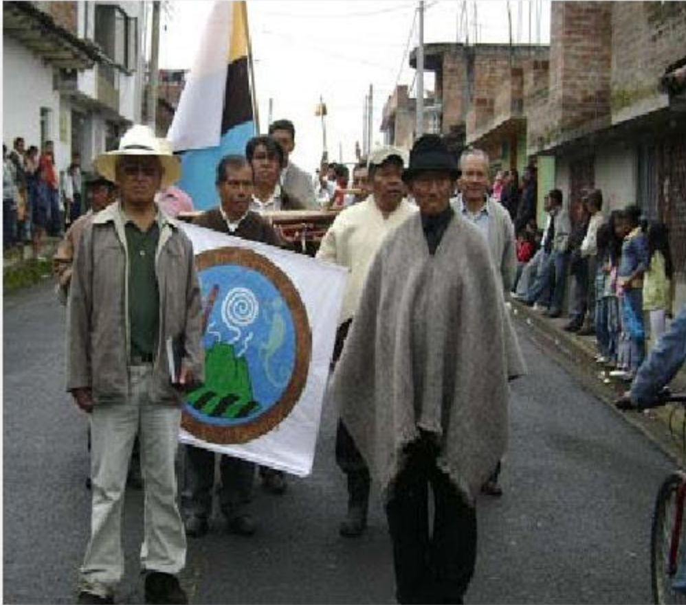
Posesión del Cabildo de Jenoy, 2008. 20