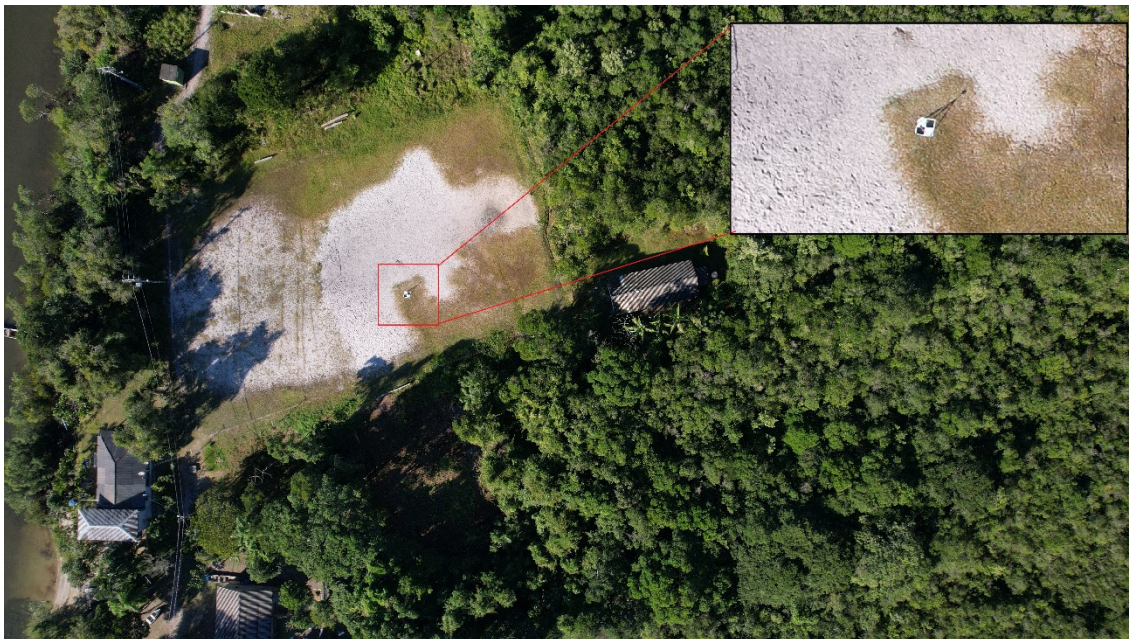
FIGURA 3. Exemplo de qualidade e detalhamento dos ortomosaicos e identificação de ponto de controle

m em voos de locais de vegetação fechada e morraria. No decorrer dos levantamentos, percebeu-se que o aerolevanteamento de precisão demonstrou ser uma valiosa ferramenta no diagnóstico do território atual das comunidades, principalmente considerando o nível de detalhamento obtido nos ortomosaicos (FIGURA 3), bem como permite aos moradores terem uma outra visão acerca do seu território de vida.