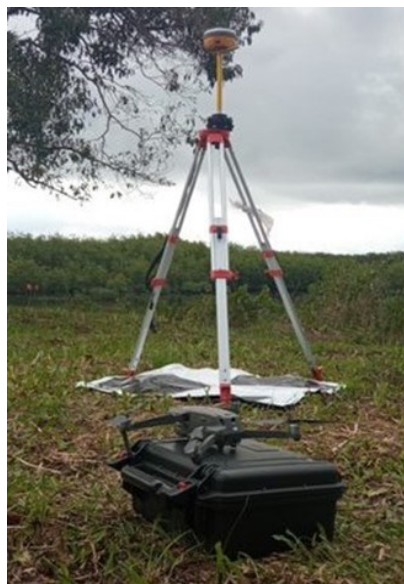
FIGURA 2. RPA DJI Mavic 2 Pro e receptor GNSS sob ponto de controle

Para a correlação entre os pontos de controle obtidos em campo (FIGURA 2) e o imageamento, foram instalados alvos quadrados preto-branco facilmente reconhecíveis nas imagens obtidas pelo levantamento aéreo, os quais possuem a função de aumentar a precisão no georreferenciamento da imagem no momento do processamento pós-voo (Zanetti, 2017). Os voos foram realizados com RPA do modelo DJI Mavic 2 Pro e DJI Phantom 4 , depois a instalação de, no mínimo, três pontos de controle distribuídos pela área de cada comunidade, conforme a sua extensão.