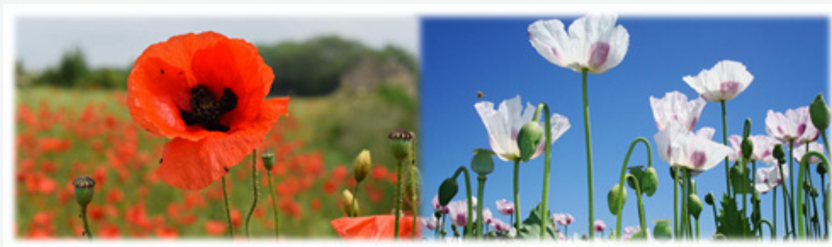
Figura 1. Algunas variedades de las flores de Amapola

El opio es una mezcla de sustancias que se obtiene desecando el jugo o látex de las cabezuelas florales del Papaver somniferum L , planta conocida como Amapola o adormidera (figura 1) [6].