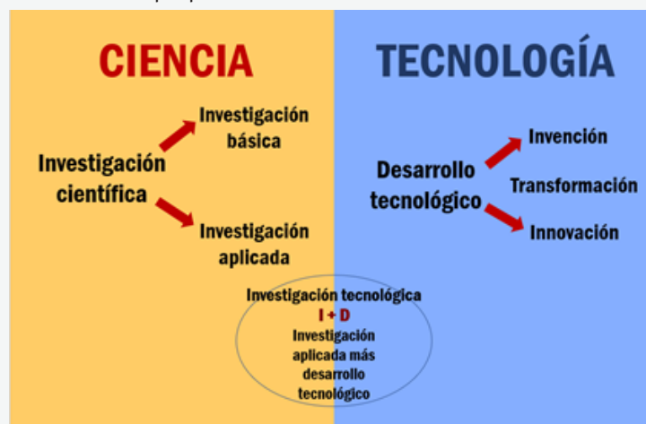
Figura 2. Relación entre ciencia y tecnología. Elaboración propia.