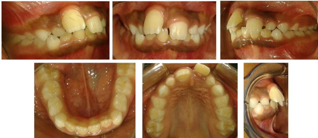
Figura N° 2. Fotografías Intraorales.

Estudios Radiográficos: La radiografía panorámica muestra anodoncias verdaderas de UD 22,25,35 y 45, no presenta patologías en zona donde fue el traumatismo dental, nivel óseo conservado en dicha zona y ápice abierto en UD 11 (Figura N° 3). Cefalométricamente el paciente presenta una Clase II esquelética por retrognatismo mandibular, ángulo góniaco de Jarabak