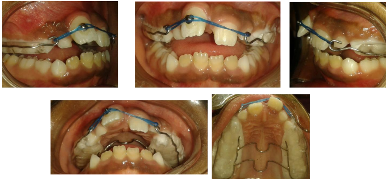
Figura N° 5. Fotografías Intraorales con Biteblock para Tracción Incisal.

cuales, servirán como aditamentos para la colocación de cadenas elastómericas para realizar la tracción incisal. De igual manera, para generar la estabilidad de la cadena a nivel de las estructuras dentales se realiza la colocación de un botón ortodóntico cementado directamente en la UD 11 (Figura N° 5).