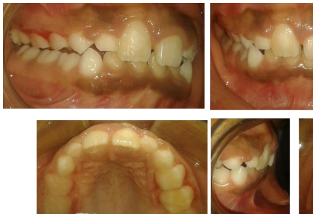
Figura N° 7. Fotografías Intraorales Finalizado Tr

Pasados 90 días se observa el éxito del tratamiento, el paciente presenta un overjet adecuado de la UD 11, buena salud periodontal y estabilidad dental (Figura N°7). Se le envió realizar una radiografía panorámica y cefálica lateral para actualizar los valores arrojados en el estudio inicial pero el paciente no regreso a consulta.