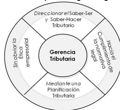
Gráfico N° 01. Representación de la temática Gerencia Tributaria y las categorías significantes.

En atención a la interpretación emergente de las categorías de análisis, surge una aproximación al concepto gerencia tributaria, dicho constructo representa su temática y las relaciones con las categorías que le dan significado en el ámbito empresarial y universitario, como se muestra a continuación: