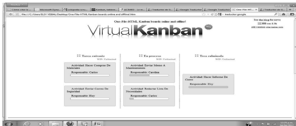
Gráfico N° 3. Ejemplo de Kanban virtual.

Un ejemplo de Kanban virtual es el que expone en el Gráfico N° 3, donde se pueden agregar columnas, tareas y porcentajes de proyectos en ejecución de manera muy sencilla.