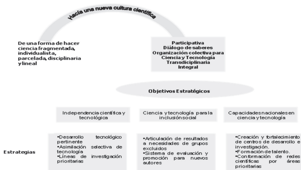
Figura 2. >>> La nueva cultura científica en Venezuela